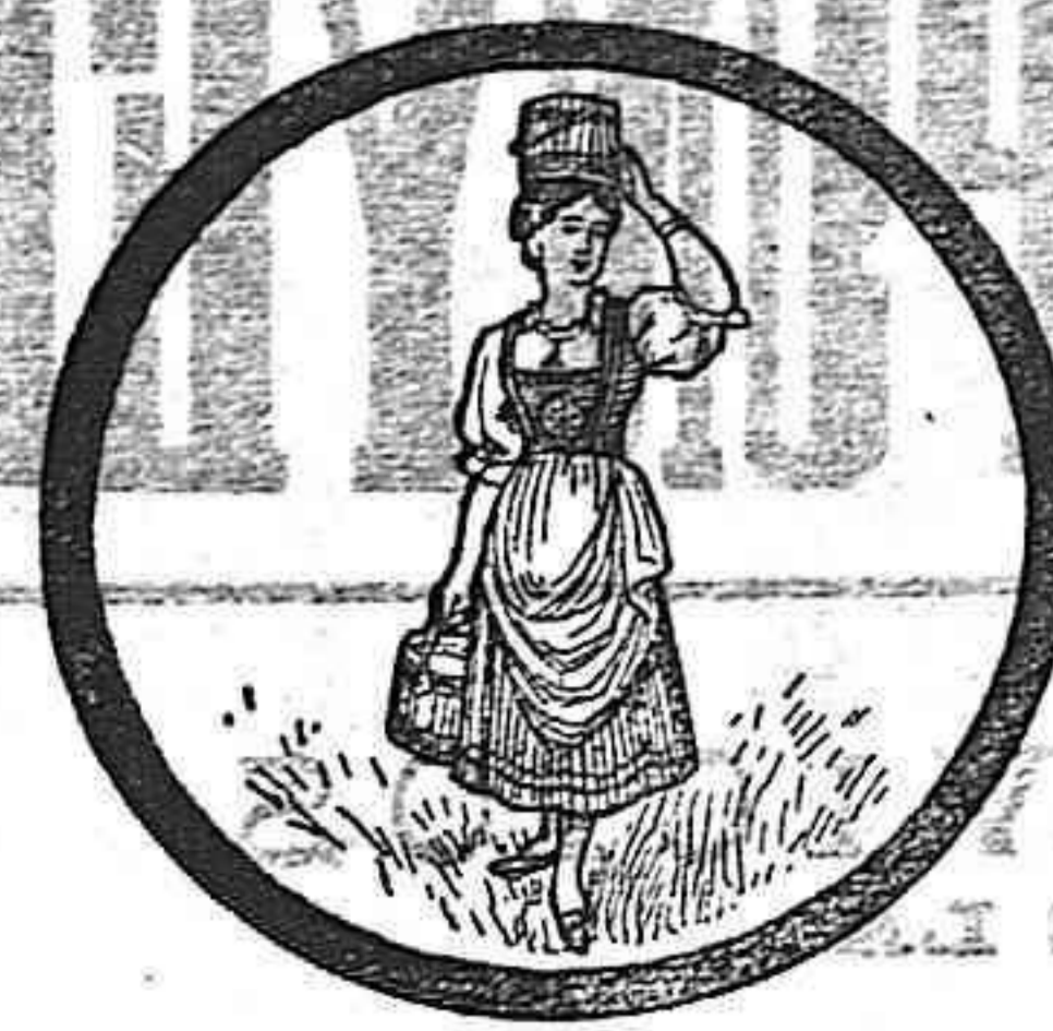
MARCA DE FABRICA

DIVERSIONES PUBLICAS. Teatro Fortuny. Grandes sesiones de cine para hoy, con estreno de interesantes películas. —Éxito de los célebres acróbatas ciclistas «Surp Duo». —Sesión desde las 9 y media de la noche. Teatro del Centro de Lectura. Gran Compañía cómica dramática dirigida por el primer actor D. Fabián Mercader. Funciones para hoy. —Tarde, en sección vermouth, la comedia en 3 actos, «¡Tenorios!». —Noche, las comedias «Francfort» y «Los Hugonotes». Kursaal de Reus. Grandes sesiones de cinematógrafo para hoy. Éxito de la pareja de bailes españoles «Sánchez Díaz». Sala-Reus. Sesiones de cinematógrafo todos los jueves, sábados, domingos y demás días festivos. Imp: Celestino Ferrando.—Reus.