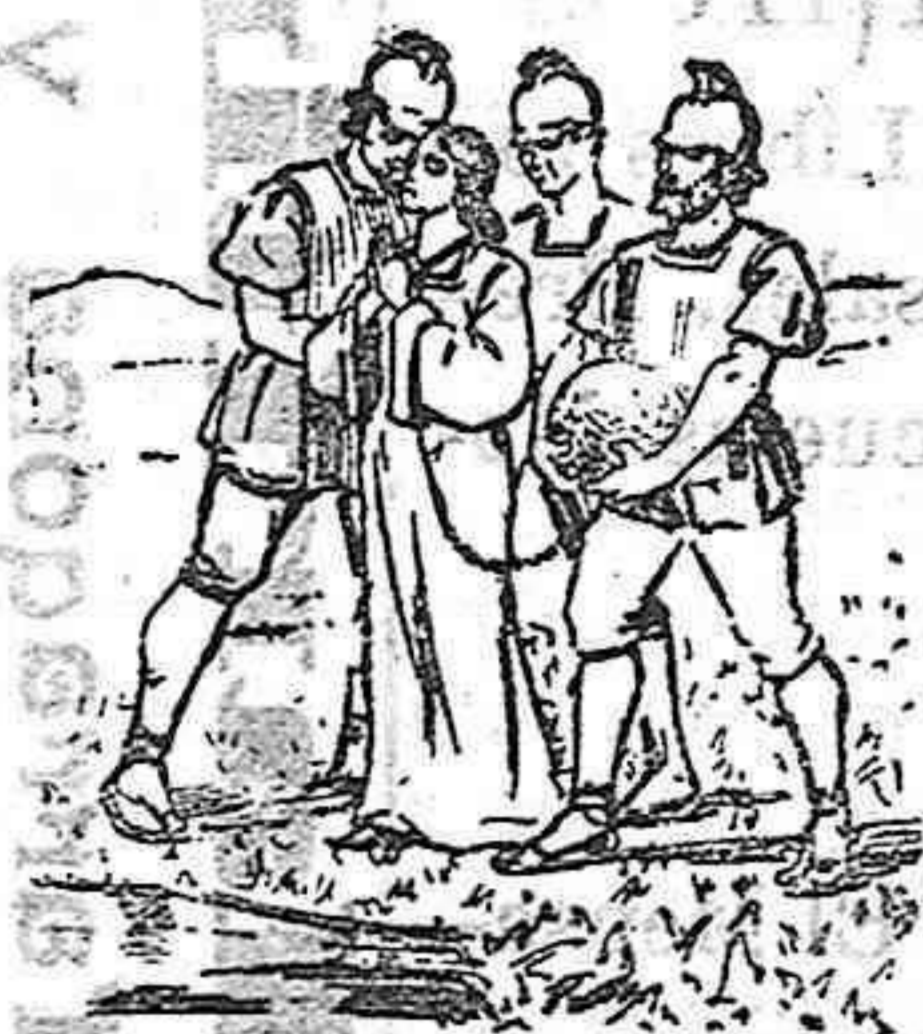
Martirologio: SANTA CLAUDIA.

SANTOS DE MAÑANA Stos Venancio, m. y Claudia, v. y mr.