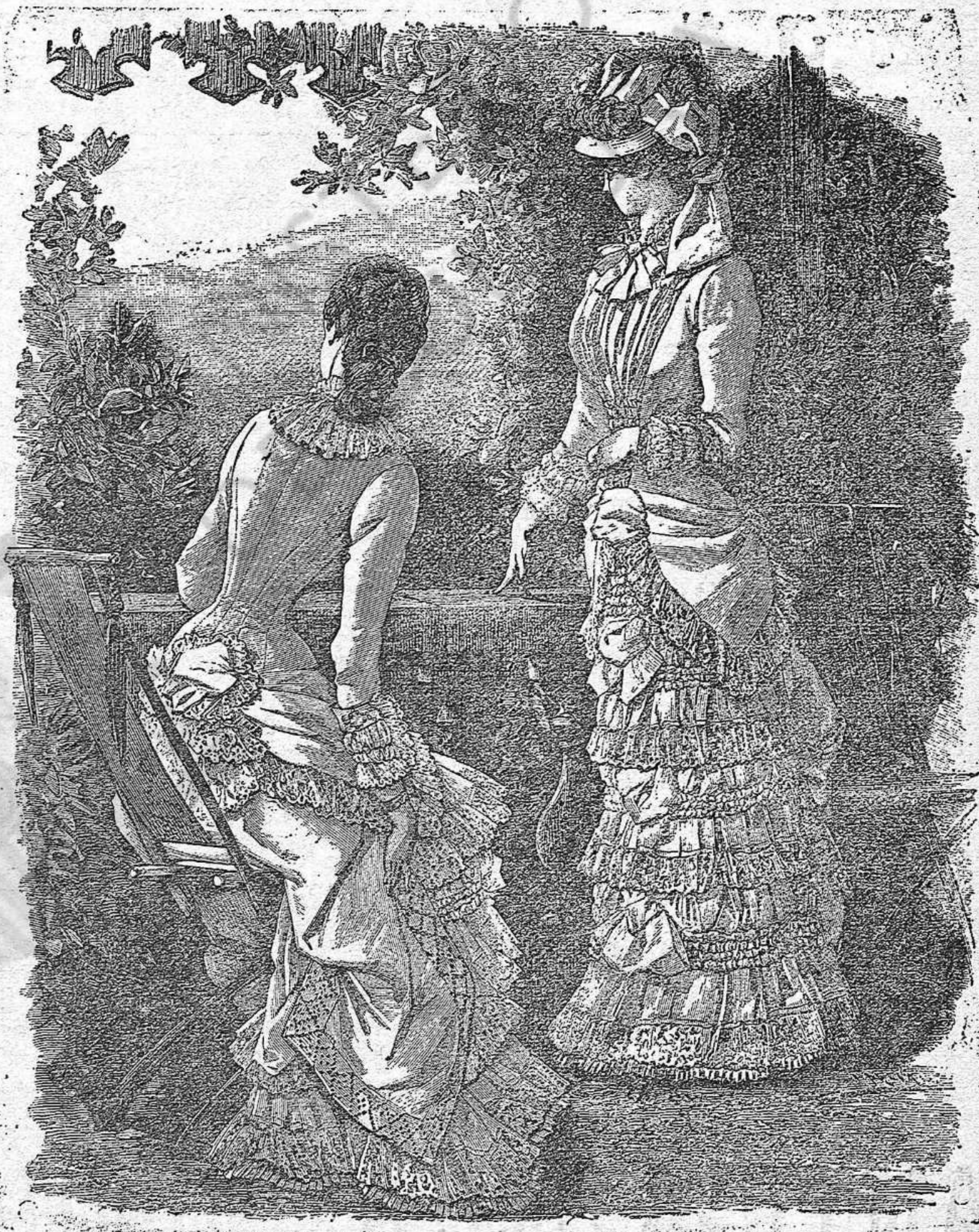
Vestit de torre.

dos aspectes (devant y darrera).—Falda de se- da, ab un plisé petit de surah. Tota la falda está coberta de farbalans alts, apuntats per quatre renglas de cuhisats y terminats per una punta alta de la Costa. Al mitx del ta- blier hi va una escala de gran llassos fets de surah.