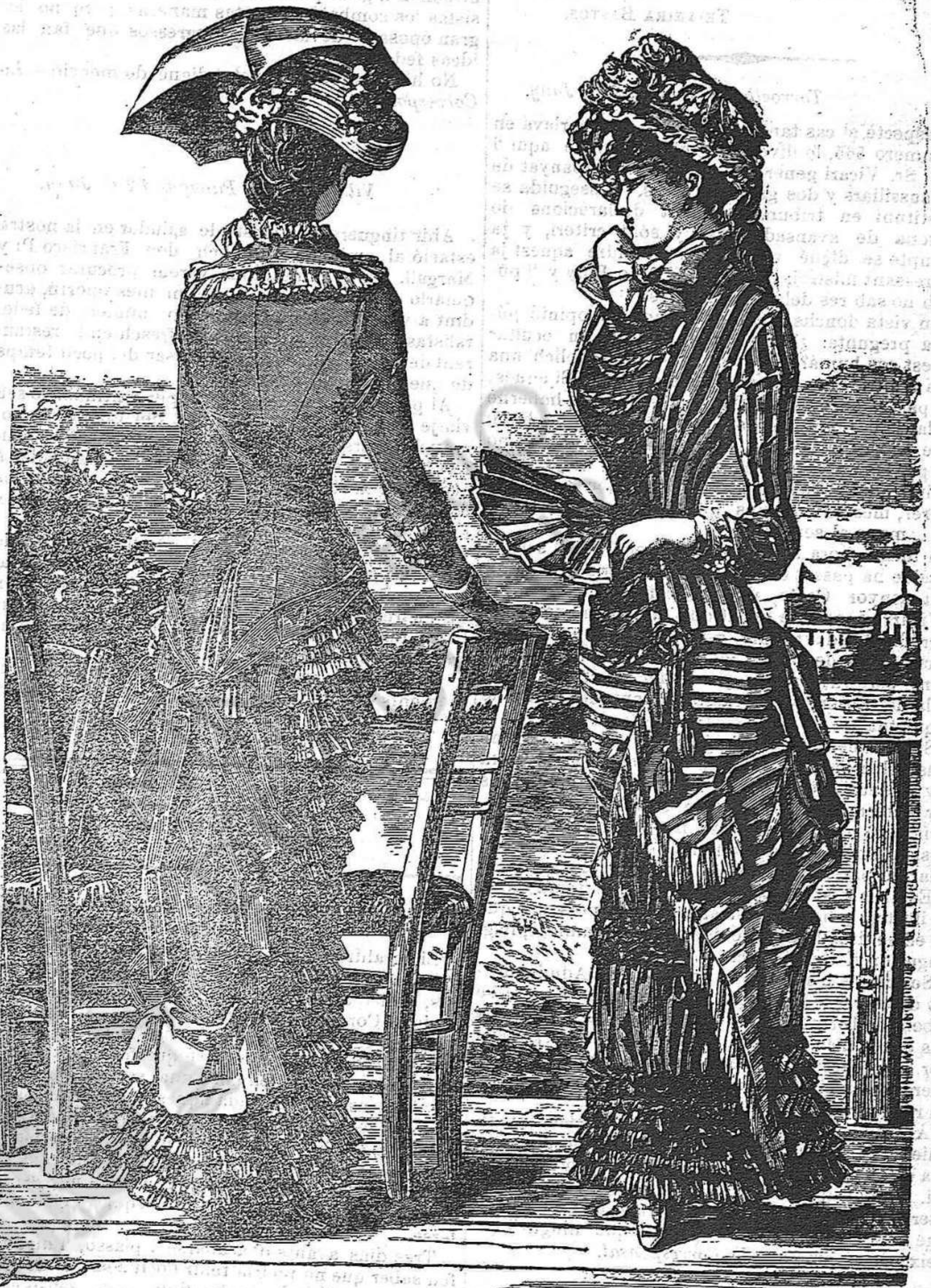
Vestits per platja de banys.