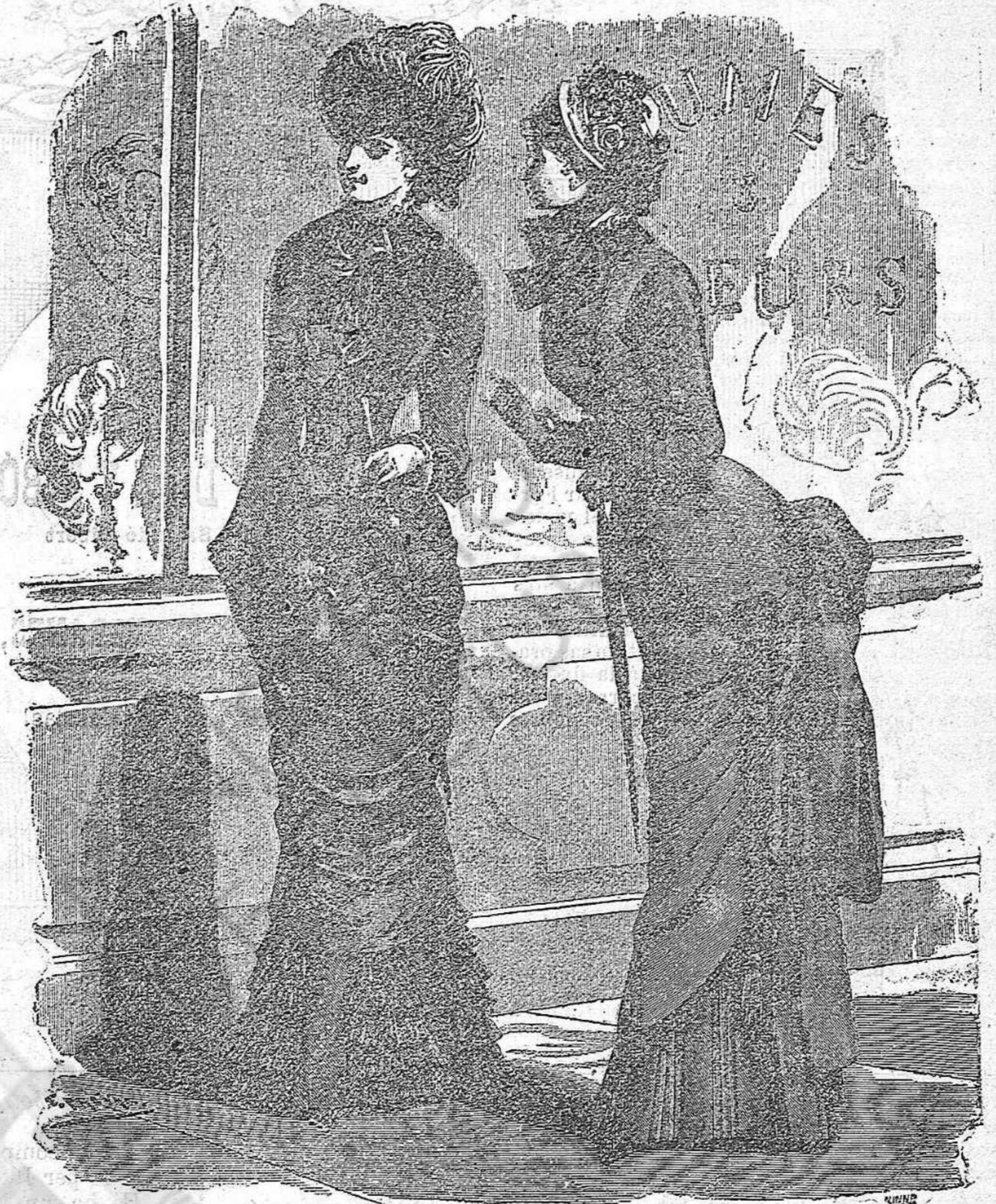
Vestit de carrer.

Núm. 2.—Roba de casimir de la India de color fusta rosa.—La faldilla va guarnida ab un alt velant format de grupos de plechs ajeguts, separats per un interval pla.—La túnica es de forma polonesa; lo devant, cordat á la esquerra fins á sobre la cadera es rodonejat al mitx per una pinsa. Lo devantal es obert en caixal en la part baixa y forma abultat al darrera. Los costats de devant, los de darrera y l' esquena pro-