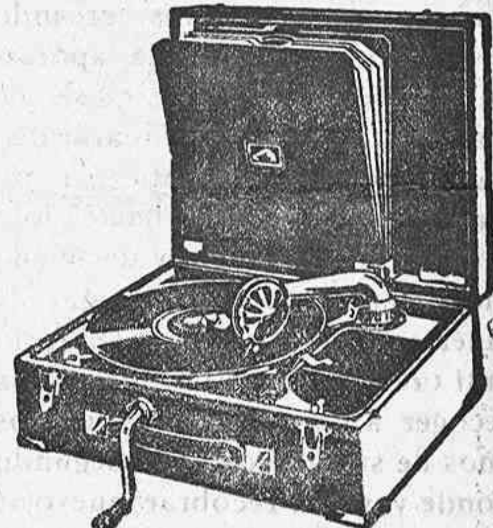
GRAMOLA, 210 ptas.

Relojes pared y bolsillo a precios muy baratos