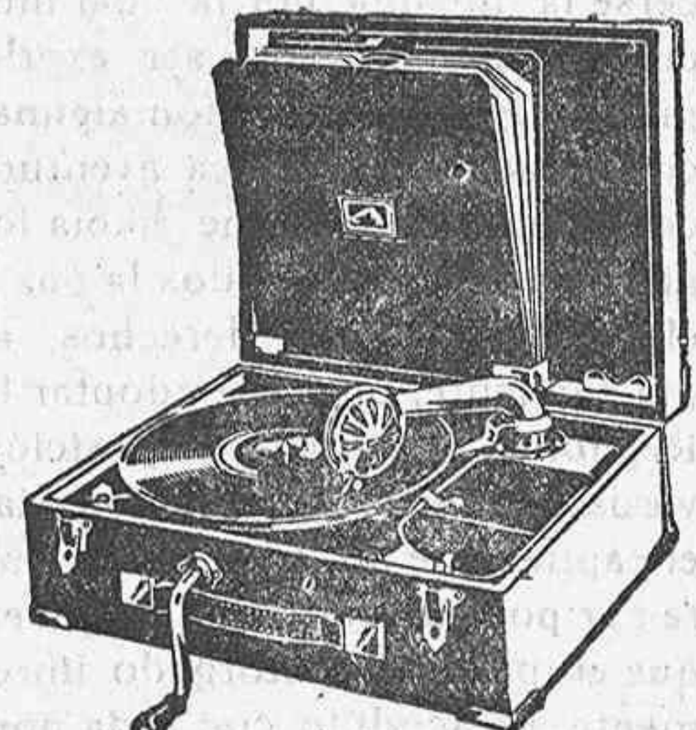
GRAMOLA, 210 ptas.

hay establecidos precios económicos a base de marcas de reconocido nombre