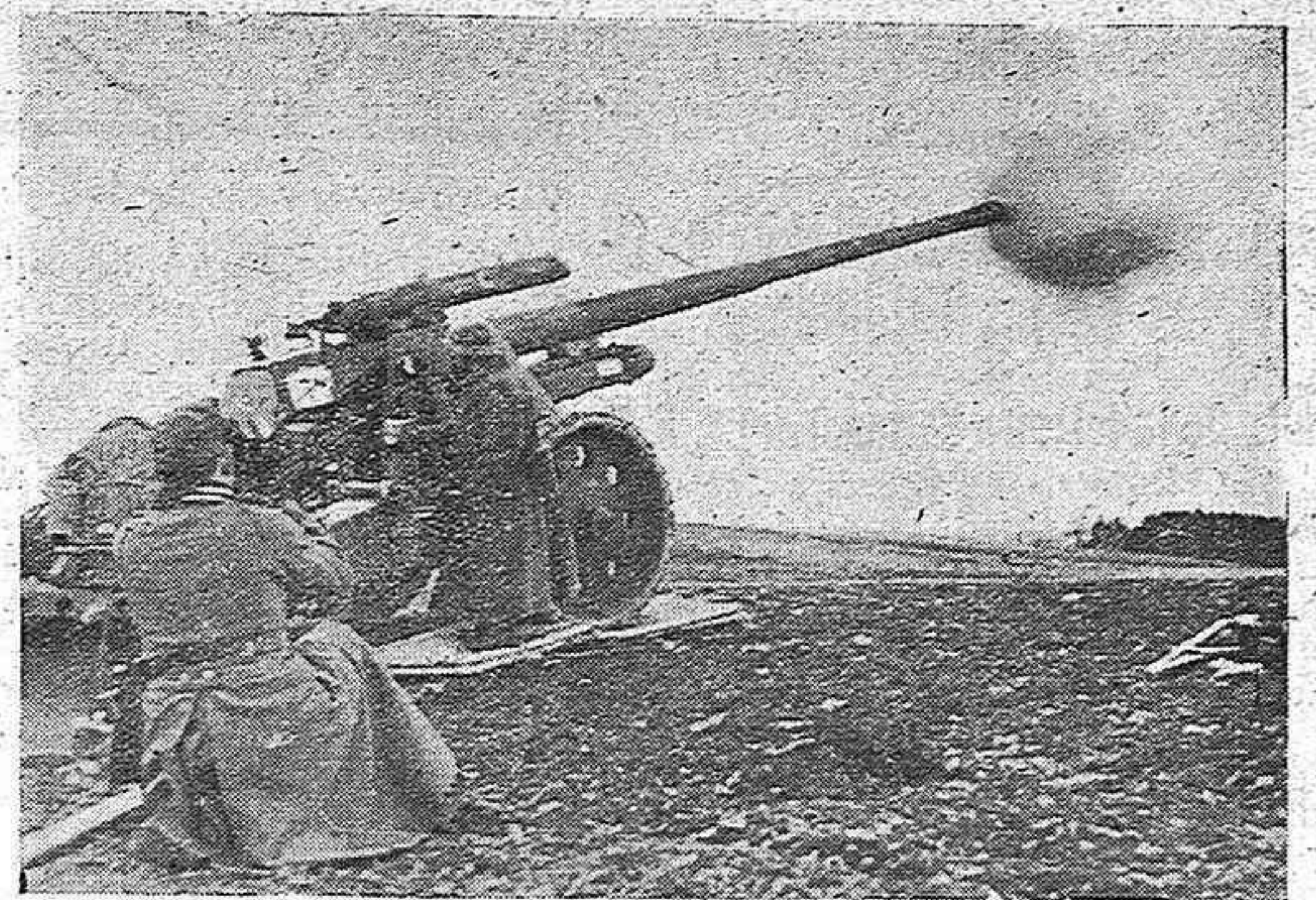
La artillería alemana cubriendo el día de hoy el día de hoy. Firmado el armisticio entre Italia y Francia a las siete y media, según estaba anunciado, seis horas después, es decir a la una y media de la madrugada han cesado las hostilidades entre los gobiernos del Eje y la República francesa.—Efe.

El Cairo, 24.—El Cuartel General de Aviación británica comunica: 70 aviones entre cazas y bombarderos, efectuaron un raid sobre Malta sin que causarían daños graves. Cinco personas resultaron heridas. Un avión enemigo fue derribado.—Efe.