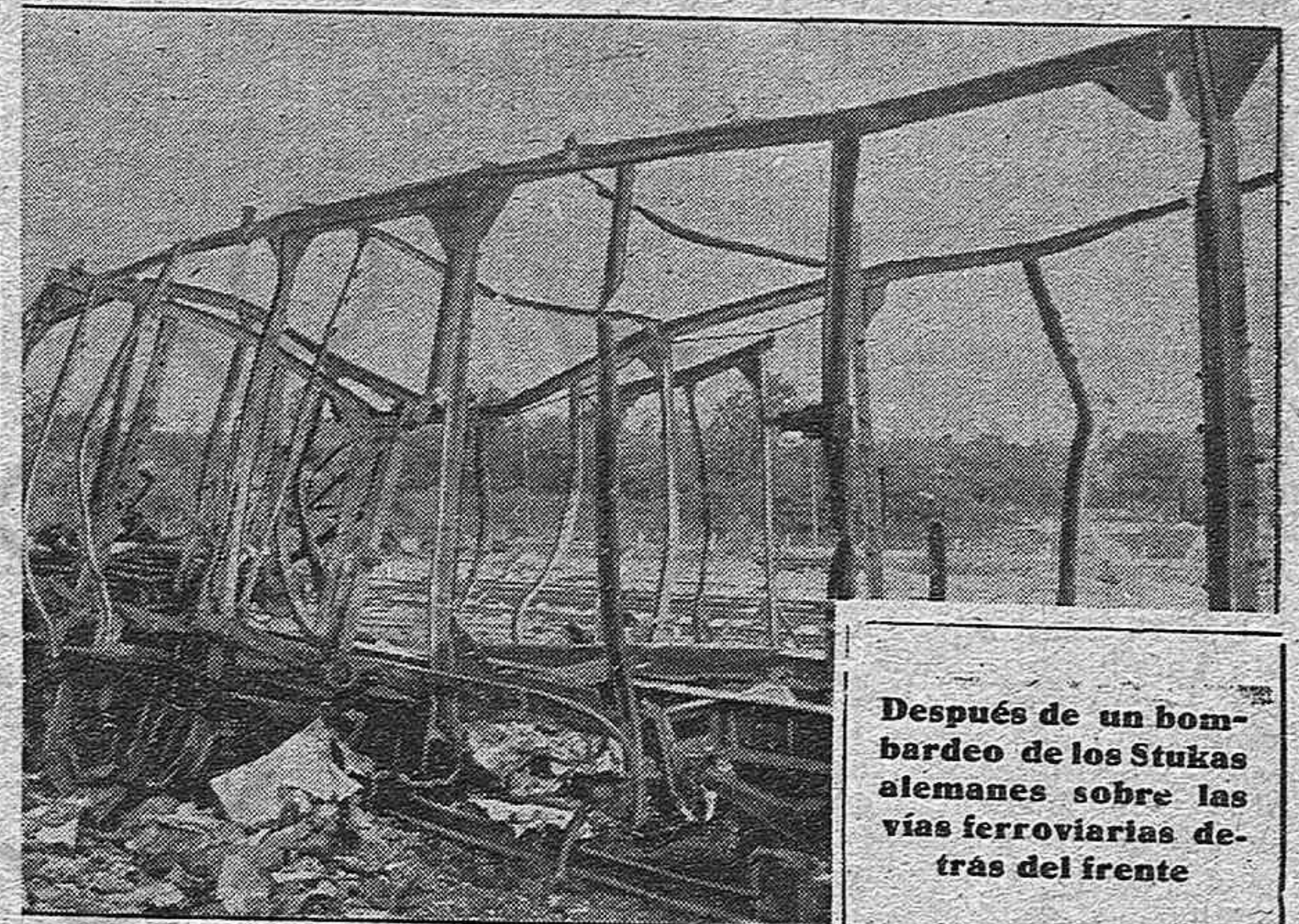
Después de un bombardeo de los Stukas alemanes sobre las vías ferroviarias detrás del frente

Pero Francia sacará provecho de la lección de esta batalla perdida. Ultimamente, Petain pidió a los franceses se pusieran al lado del Gobierno. «Se trata, dijo, de Francia y sus hijos». — Efe.