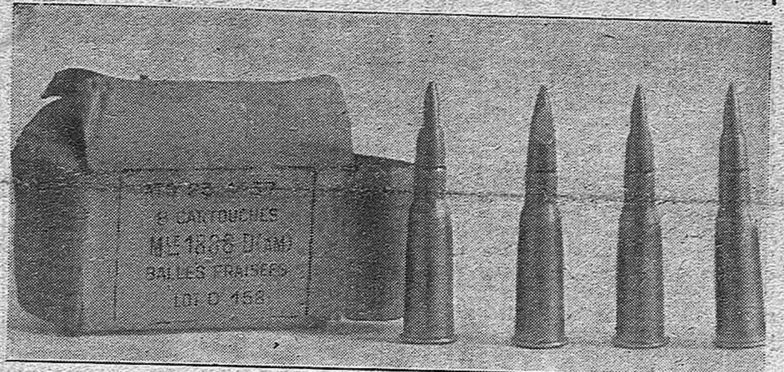
En el Norte de Francia encontraron las tropas alemanas gran cantidad de municiones «Dum-Dum»

Burdeos 20, (10 noche). — El general Petain ha anunciado al alcalde de Burdeos que la ciudad había sido declarada ciudad abierta. — Efe.