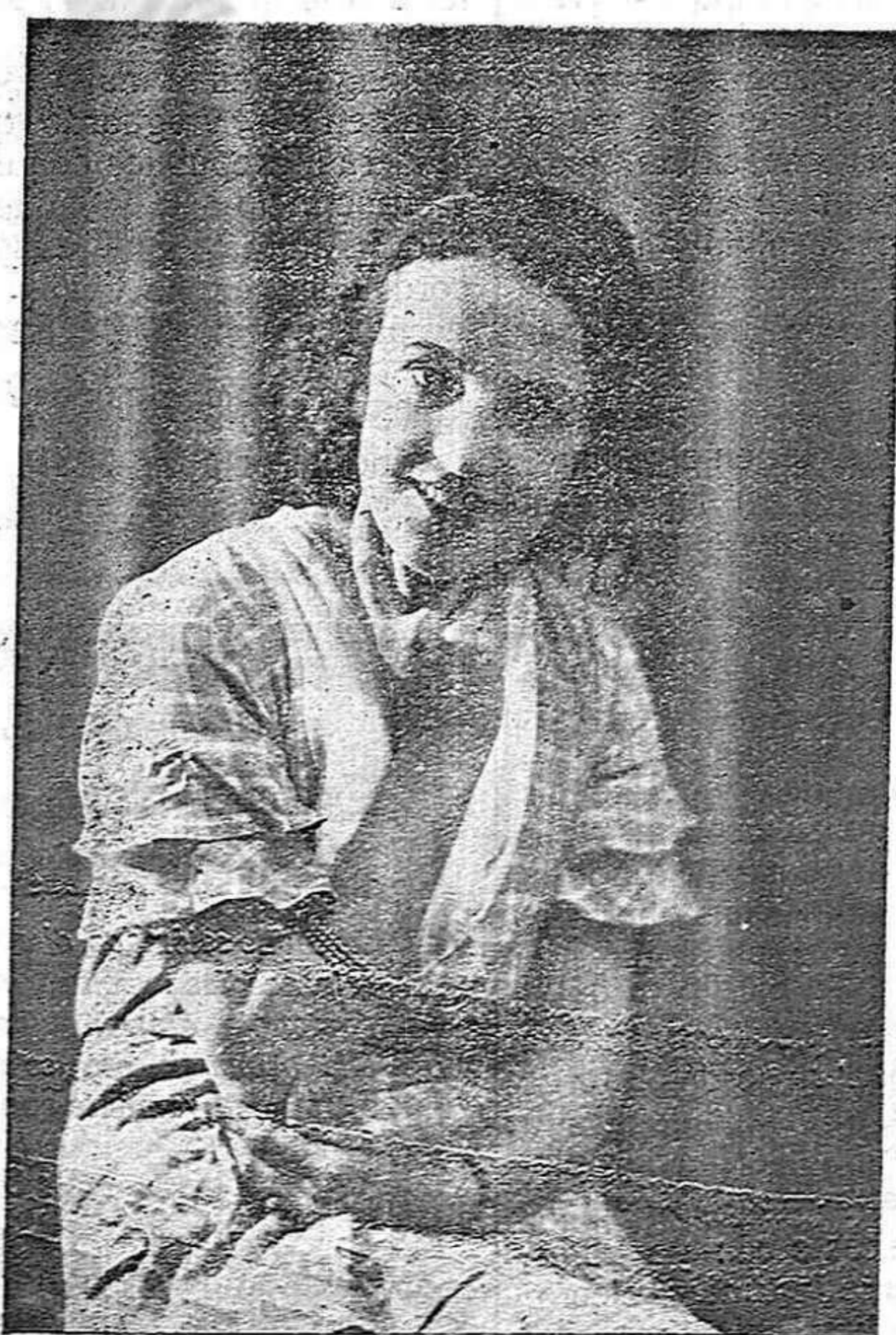
SEÑORITA SORIA 1931

El criterio del Sr. Lerroux sobre lo que debe ser la Constitución es que ésta no debe conceder los principios que supongan una desigualdad de trato para los distintos ciudadanos, en el sentido de evitar que éstos queden escindidos constitucionalmente, sobre todo en materia religiosa y en aquellos preceptos que presuman persecución, a un cuando se deben consignar en la Constitución otros que conduzcan a evitar, prevenir e imponerlos en caso necesario.