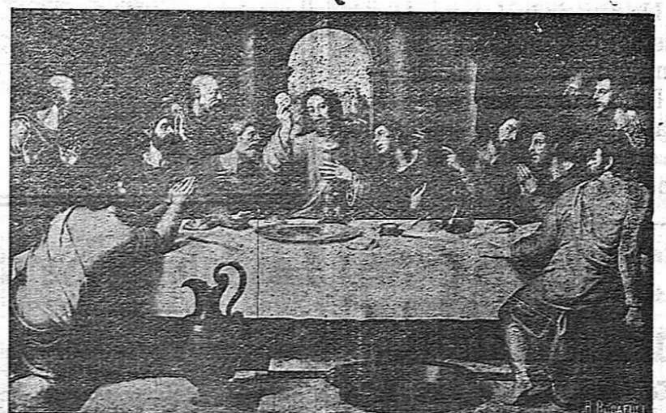
LA CENA DE JESUS