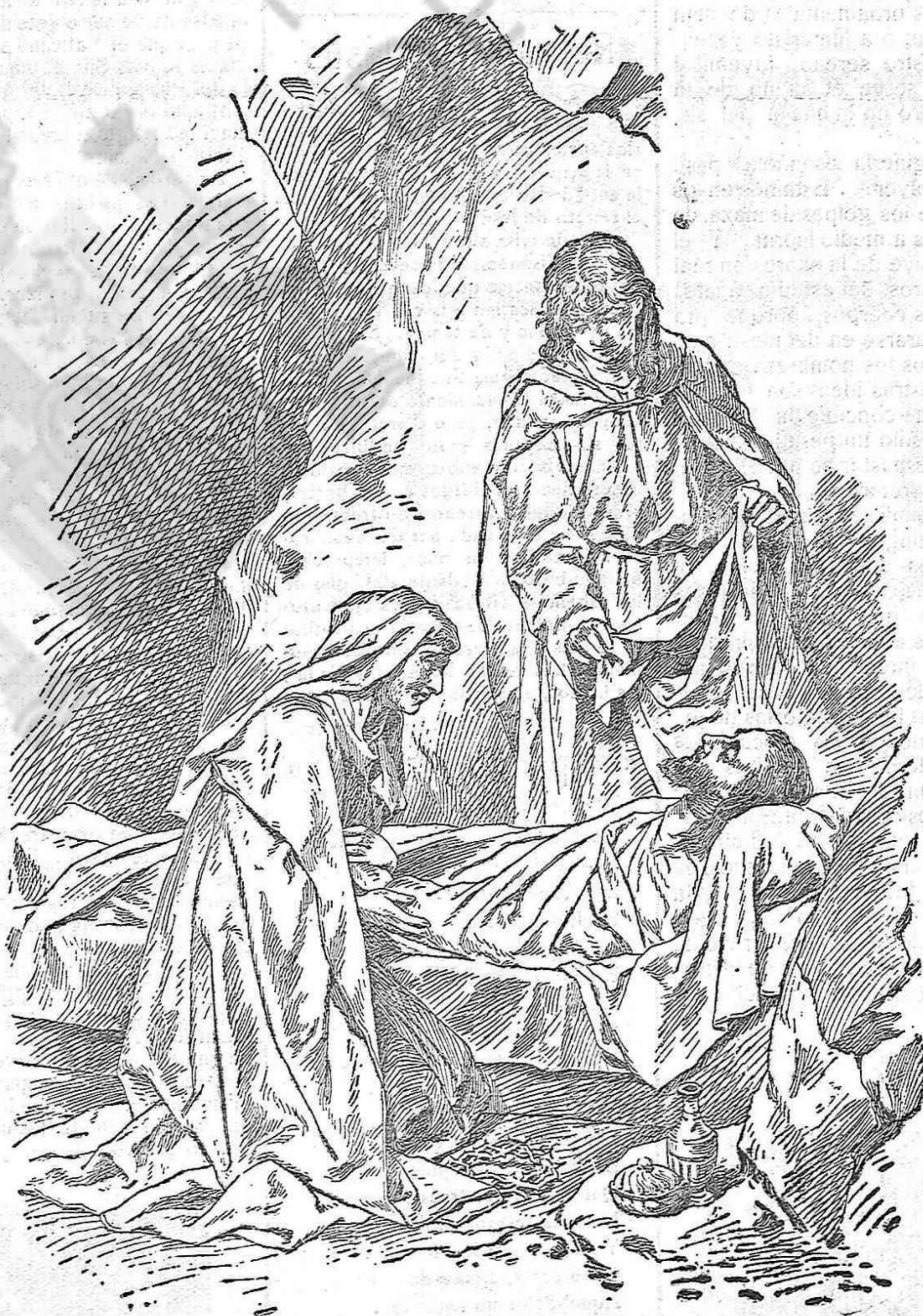
JESÚS EN EL SEPULCRO