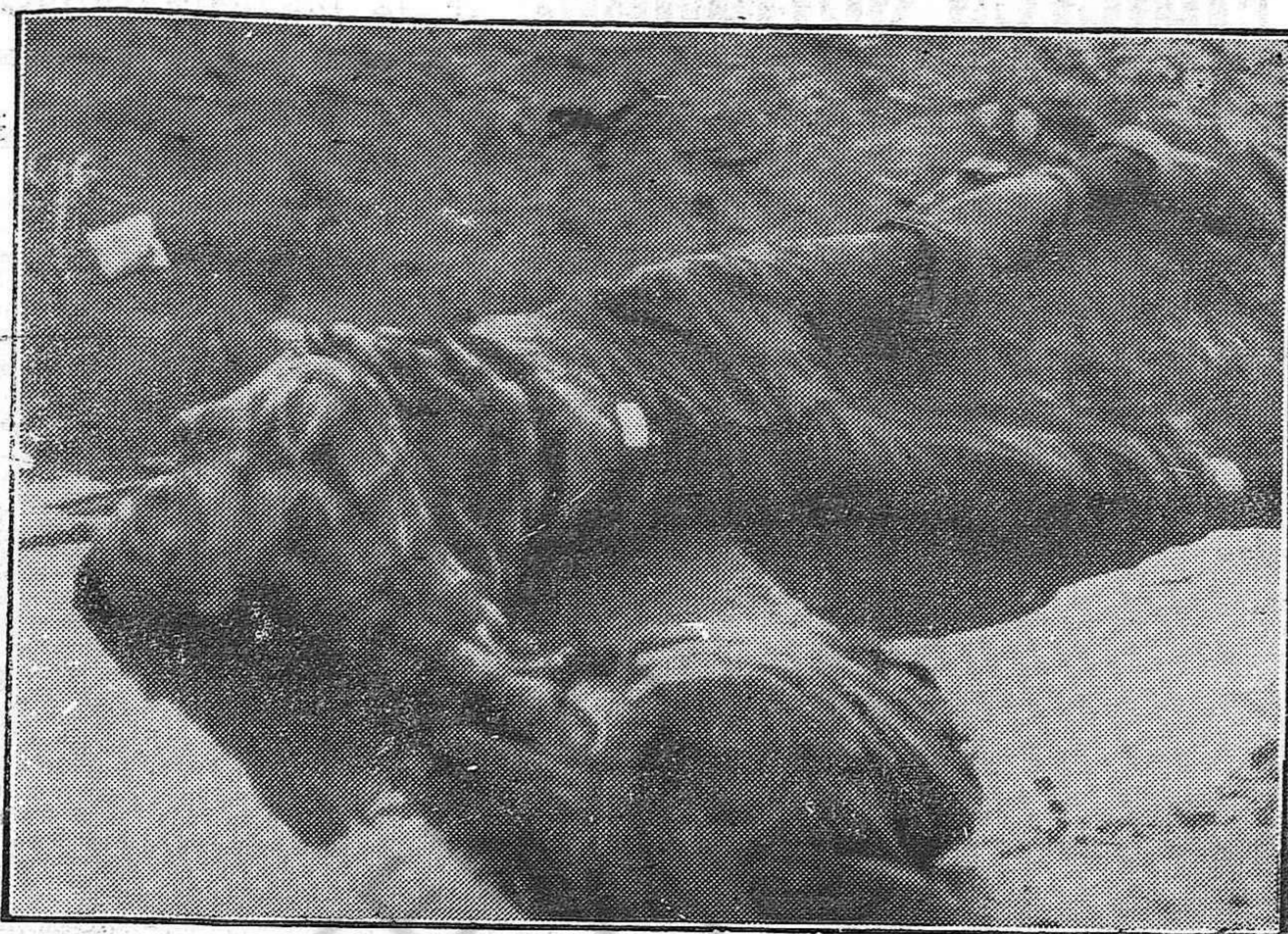
Al avanzar nuestras tropas por las regiones del Norte se han encontrado con casos como este en que un pobre miliciano sin duda descubierto en el momento de tratar de evadirse ha sido barbaramente martirizado después de ser amarrado a un tronco de árbol

Dios guarde a VV. EE. muchos años.—Burgos 13 de Octubre de 1937.—II Año Triunfal.—Francisco G. Jordana.—Excmos. Sres. Presidente de la Comisión de Industria, Comercio y Abastos y Gobernador general del Estado.