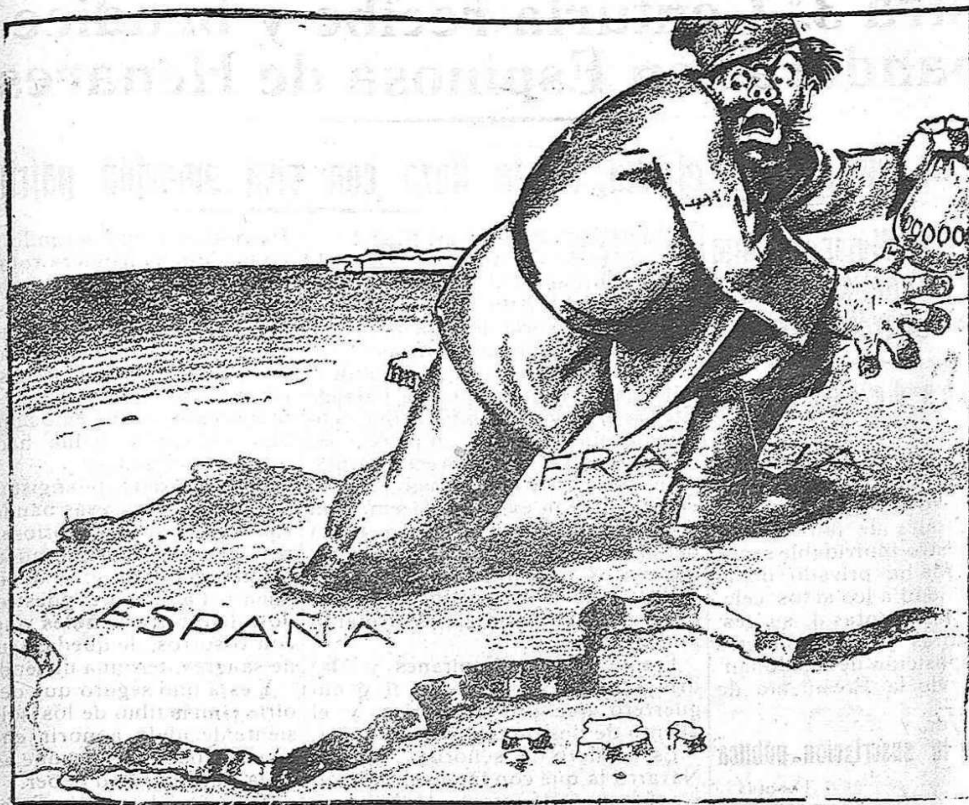
El ladrón moscovita se siente atrapado