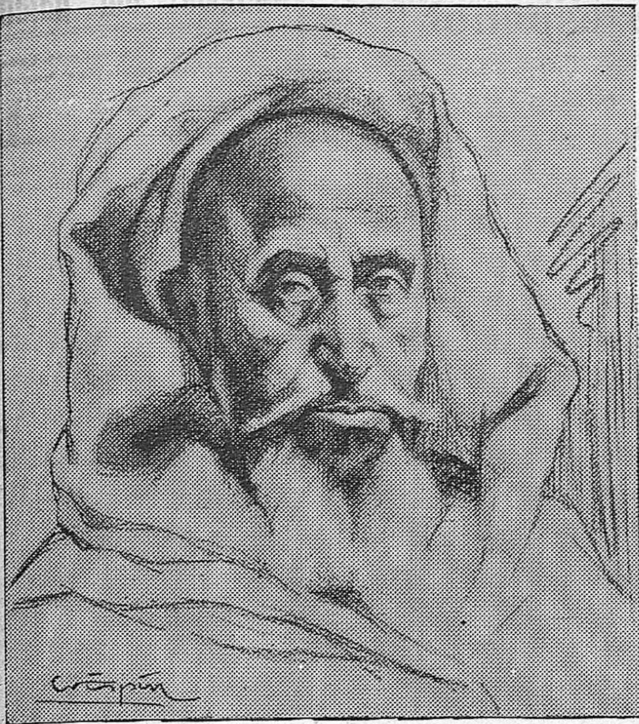
Dios os salve viejos guerreros del Islam. Vosotros soldados hermanos, guerrilleros leales de la auténtica España, en esta hora de triunfos de todos, en que nuestras banderas vuelven a gozar de luces y sol en las tierras humilladas de Vasconia, os recordamos con toda la gratitud de que es merecedor vuestros sacrificios y vuestras lealtades. Dios os salve y os tenga presente y recibid con el ardiente entusiasmo que hacia nuestro Ejército glorioso parte de todos los corazones de España, la parte que os corresponde en la obra común realizada. ¡Gran Visir de la raza hermana! A todos os tenemos presente en esta hora de triunfo y de grandeza.