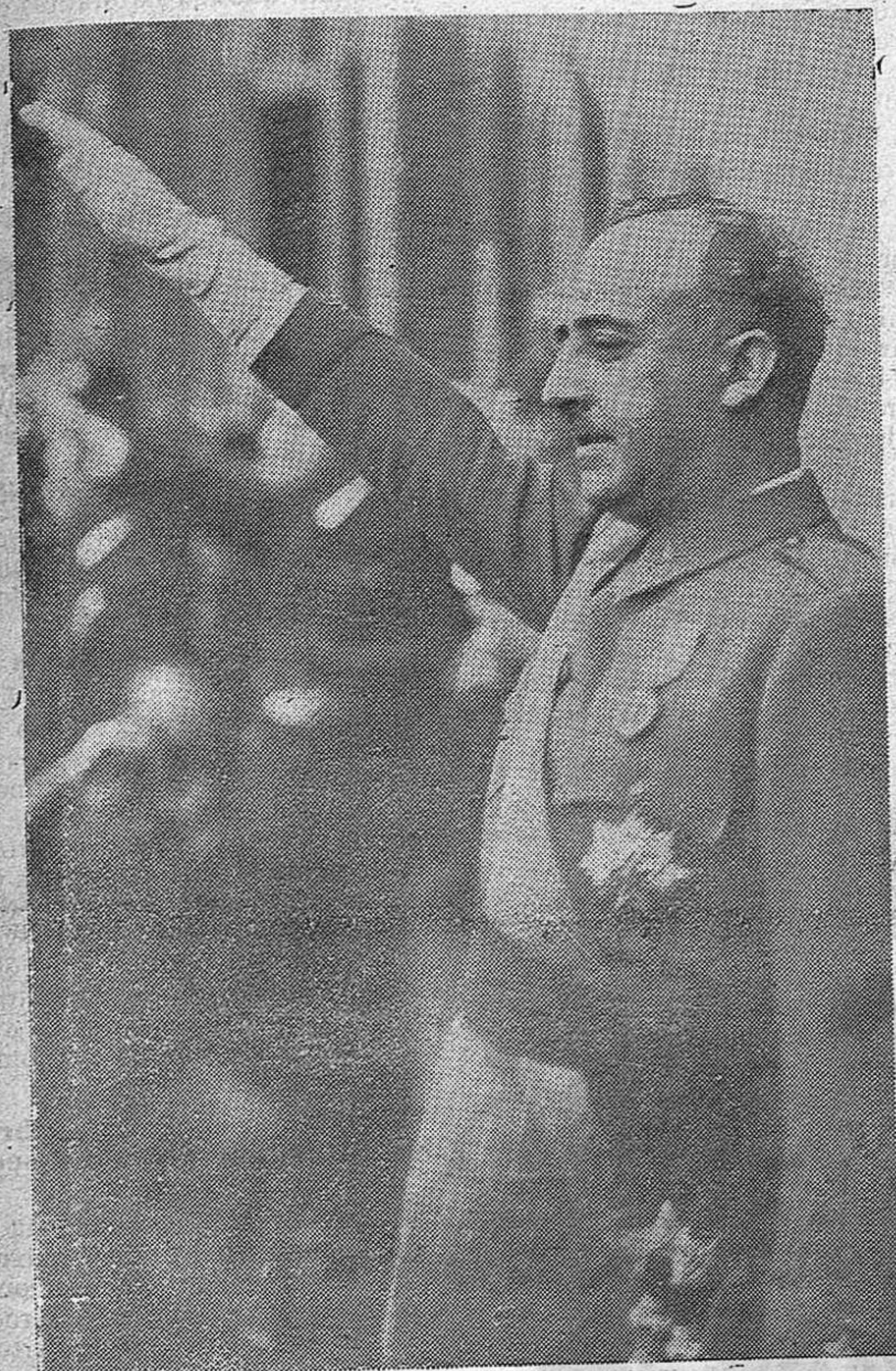
En la alegría que nos produce la conquista de Bilbao, te saludamos César invicto, con el brazo en alto también; del mismo modo que tú saludas al pueblo. Generalísimo de España, Capitán de la Falange Tradicionalista: ¡Arriba España!!