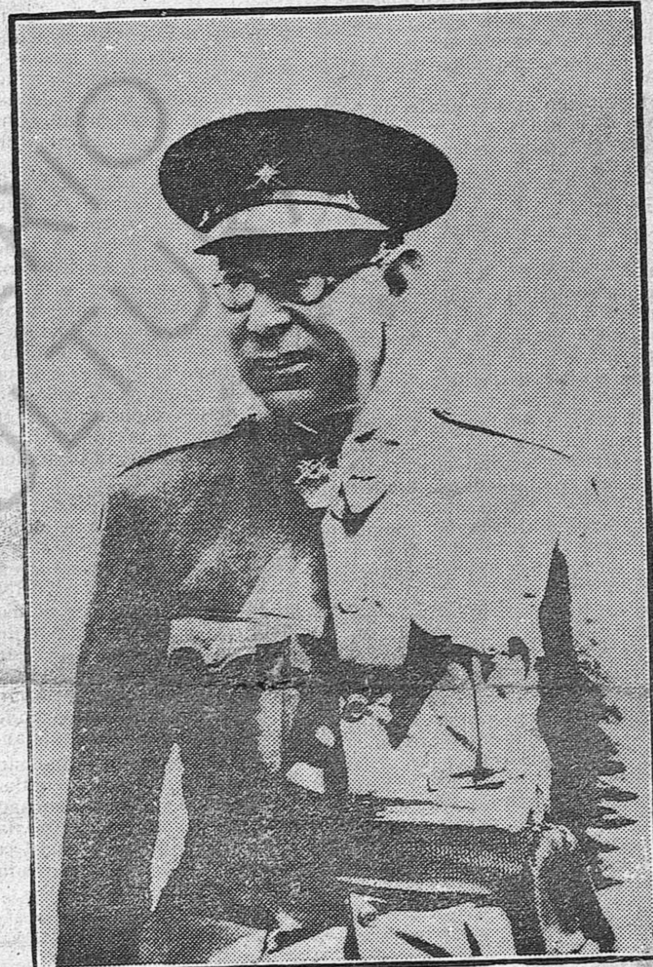
Volvemos a honrar hoy las páginas de LABOR con la figura gloriosa del General Mola a quien España entera levanta en estos momentos su recuerdo de gratitud y devoción con motivo de la conquista de Bilbao. Forjador de la gran victoria, ha estado presente en todos los corazones al recoger su obra que con su nombre serán inmortales.

Parece que se trata de una última gestión de Inglaterra cerca del Gobierno francés, antes de decidirse a obrar por su cuenta.