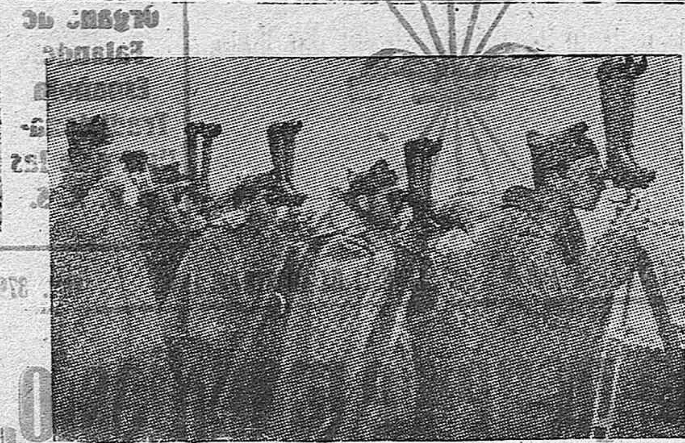
Oficiales del Estado Mayor siguiendo con sus telemetros el avance de nuestros soldados