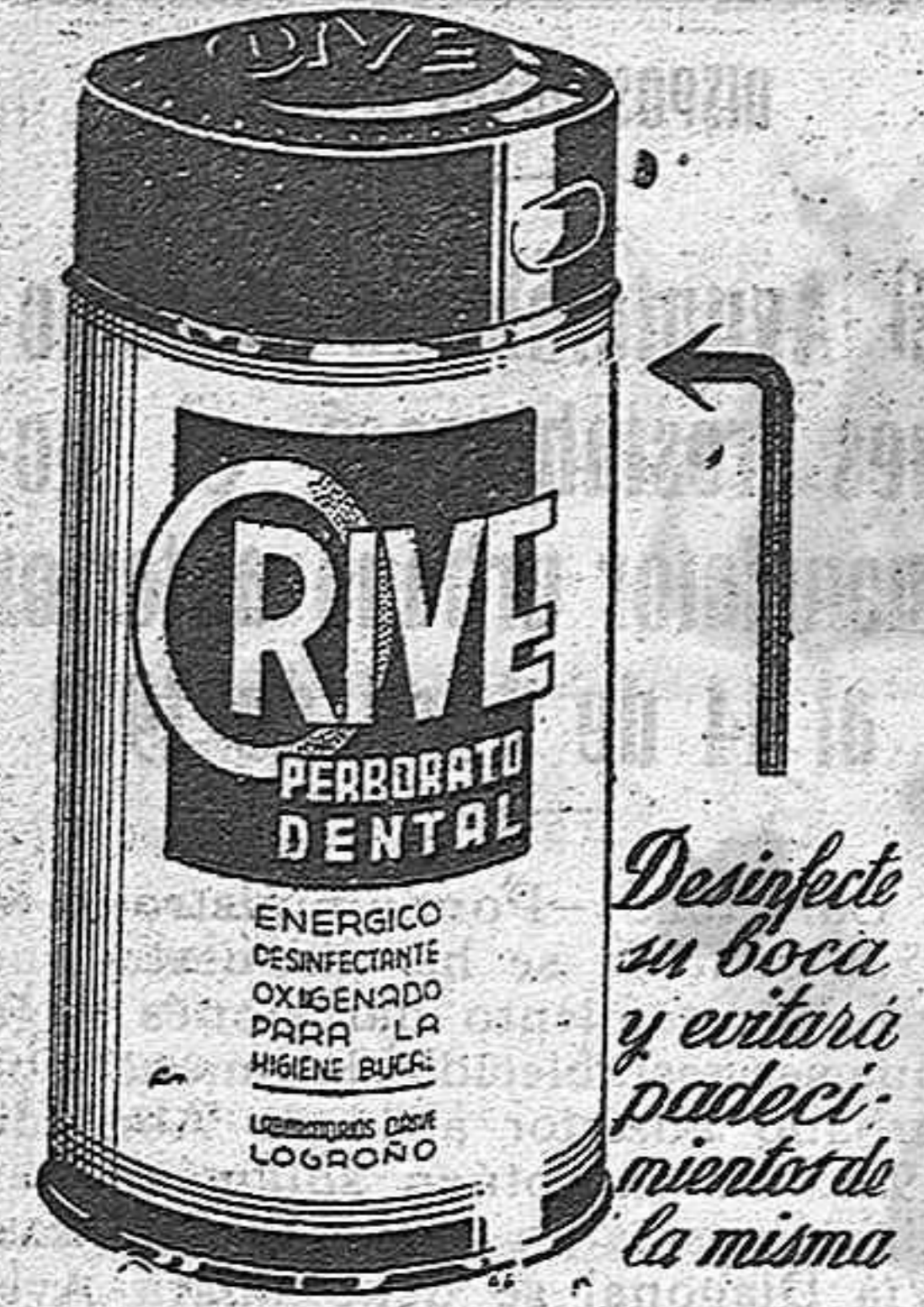
Desinfecte su boca y evitara padecimientos de la misma

MAXIMO ANTON TECNICO MECANICO CLAUSTRILLA, 7 SORIA