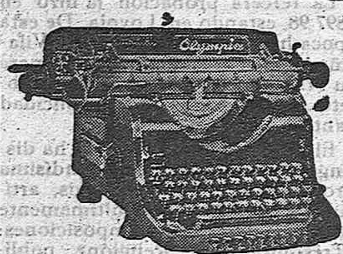
Taller de reparaciones de Máquinas de ESCRIBIR, CALCULAR y COSER

Día 24, lunes. — S. Fidel de Simaringa, Sabas, Alejandro, Eusebio, Neón, Leoncio, Longino, mrs; Melito, Gregorio, Honorio, obs; Egberto, pb; Boná, Doda, vgs. La misa es de San Fidel; con rito doble y color encarnado. 2.ª oración imperada. Gloria sin Credo. Prefacio pascual.