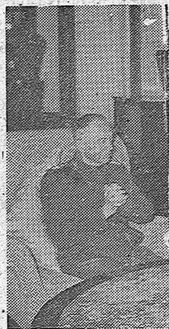
El general Antonescu

mente agredido a su Ejército. Todos los culpables serán juzgados in-