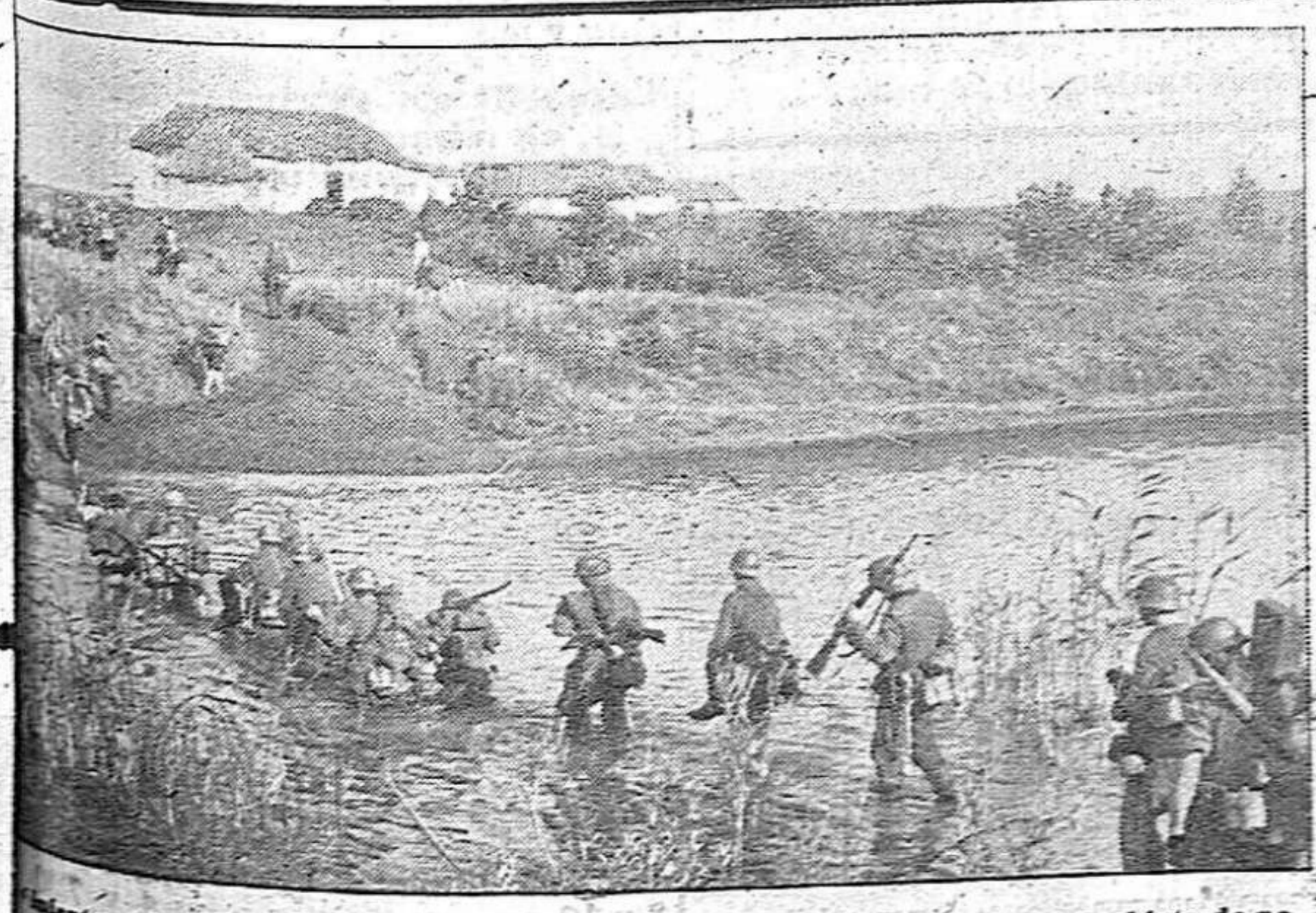
Almohades alemanes atraviesan a pie un río en persecución del enemigo, con objeto de no dejarle ni un segundo de descanso.