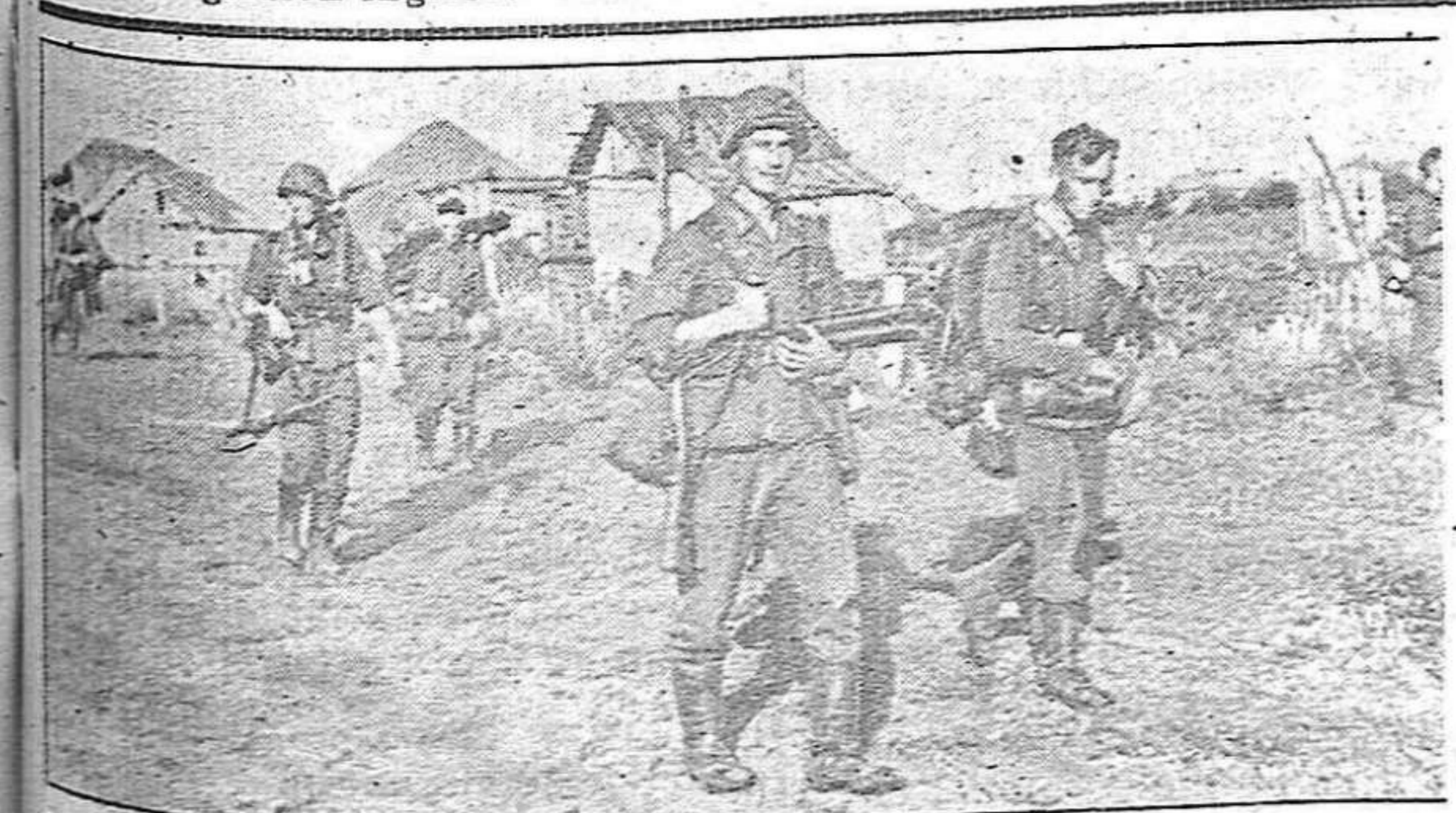
Siempre adelante siguen los soldados alemanes Batallón alemán de infantería atraviesa un pueblo ruso y sigue su avance por un monte

Vichy, 10. — Los ingleses han desencadenado un ataque general contra los puertos de la costa occidental de Madagascar según anuncia el comunicado británico. Después del intento fracasado de desembarco en Majunga, a primera hora de la mañana la flota ha atacado los puertos de Majunga, Ambaja y Morvudeawa con apoyo de la aviación. Es incalificable la agresión inglesa. — Efe.