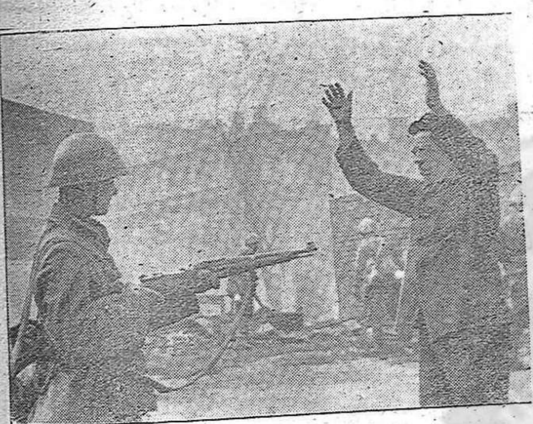
1. Soldados de una división eslovaca hicieron gran cantidad de prisioneros durante los combates que se desarrollaron en una ciudad rusa. Aquí se ve a un soldado ruso en el momento de entregarse. 2. Vigilancia en la costa. Soldados alemanes cargando un cañón y preparándolo para hacer fuego contra el enemigo