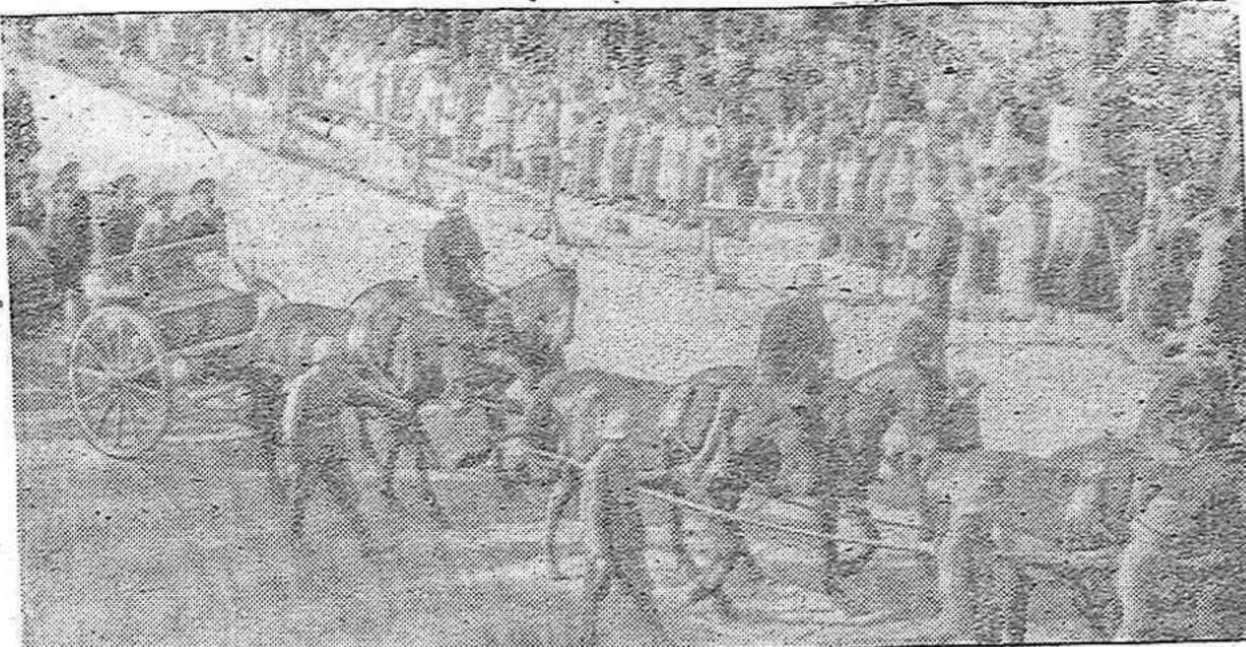
Entierro del hijo del Jefe del Estado húngaro von Horthy, en Budapest

Para la Hungría moderna, el nombre de Nicolás de Horthy representa la más sólida garantía de la continuidad del orden, en el que viene dirigiendo el Estado desde hace dos décadas. Su tarea ha sido difícil: Trianon había fuertemente sacudido las bases mismas de la nación; el bolchevismo triunfante logró en seis meses minar todas las fuerzas vivas que hubieran podido limitar el desastre y la derrota, pero Nicolás de Horthy ha sabido mantener en los húngaros el sentimiento puramente nacional, ha logrado restablecer la disciplina y conducir a su pueblo hacia un trabajo fecundo.