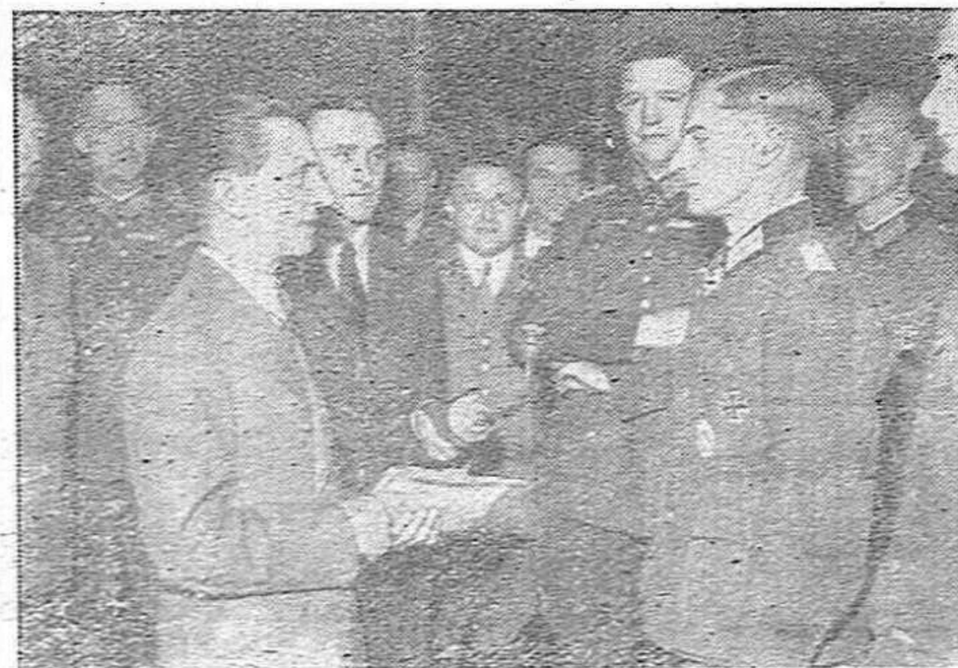
1. Componentes de Sebastopol, huéspedes del Ministro del Reich Dr. Goebbels. La foto muestra en conversación con algunos combatientes alemanes de la armada de Crimea, que están bajo el mando del General Mayor Wolf. — 2. El general Gahima en el frente del Este. El embajador japonés en Berlín, general Oshima efectuó un viaje de inspección a los campos de batalla de Rostov y Batisk. Al general Oshima le es explicada la situación de las tropas en un mapa por el capitán general alemán Ruoff.

Informes e inscripciones en los locales del Colegio: AGUIRRE, 6 1-6 (Antiguo Banco de España)