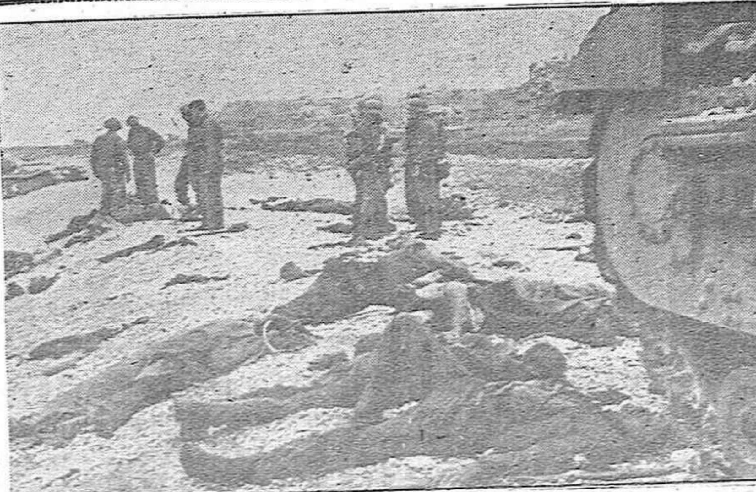
Caidos británicos y tanques destruidos, es el resultado del intento de desembarco inglés en la costa francesa.