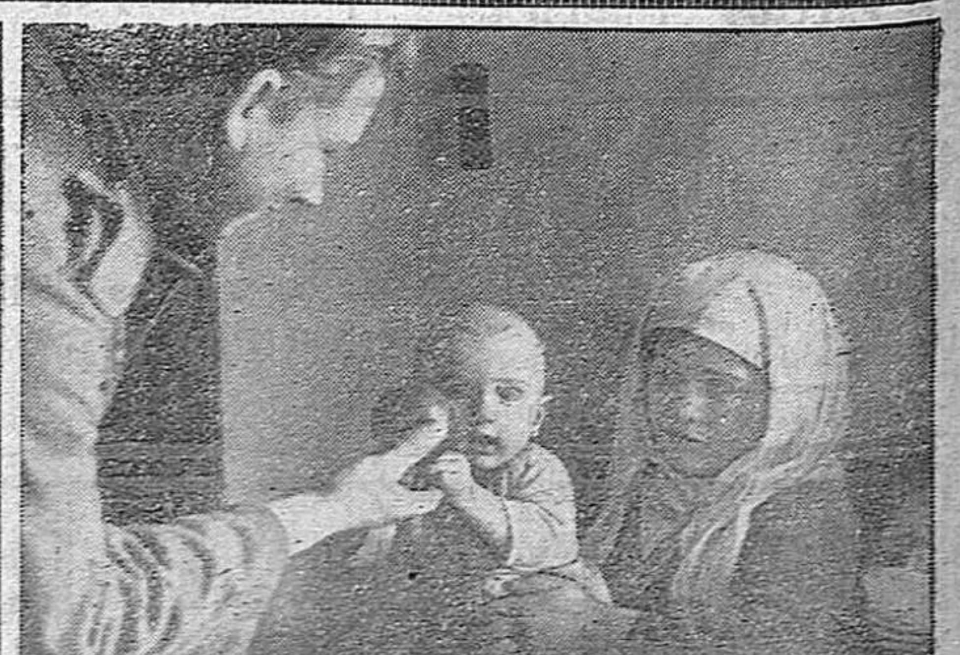
Un pequeño ucraniano recogiendo el juguete que le ofrece con la mejor sonrisa un soldado alemán