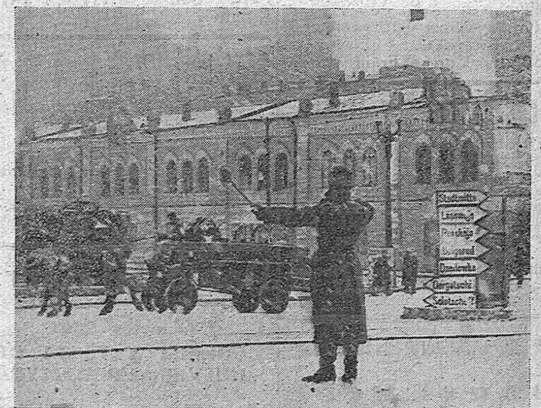
La ciudad de Charkow, sobre la que cae una buena nevada. Soldados alemanes son encargados del tráfico en las calles