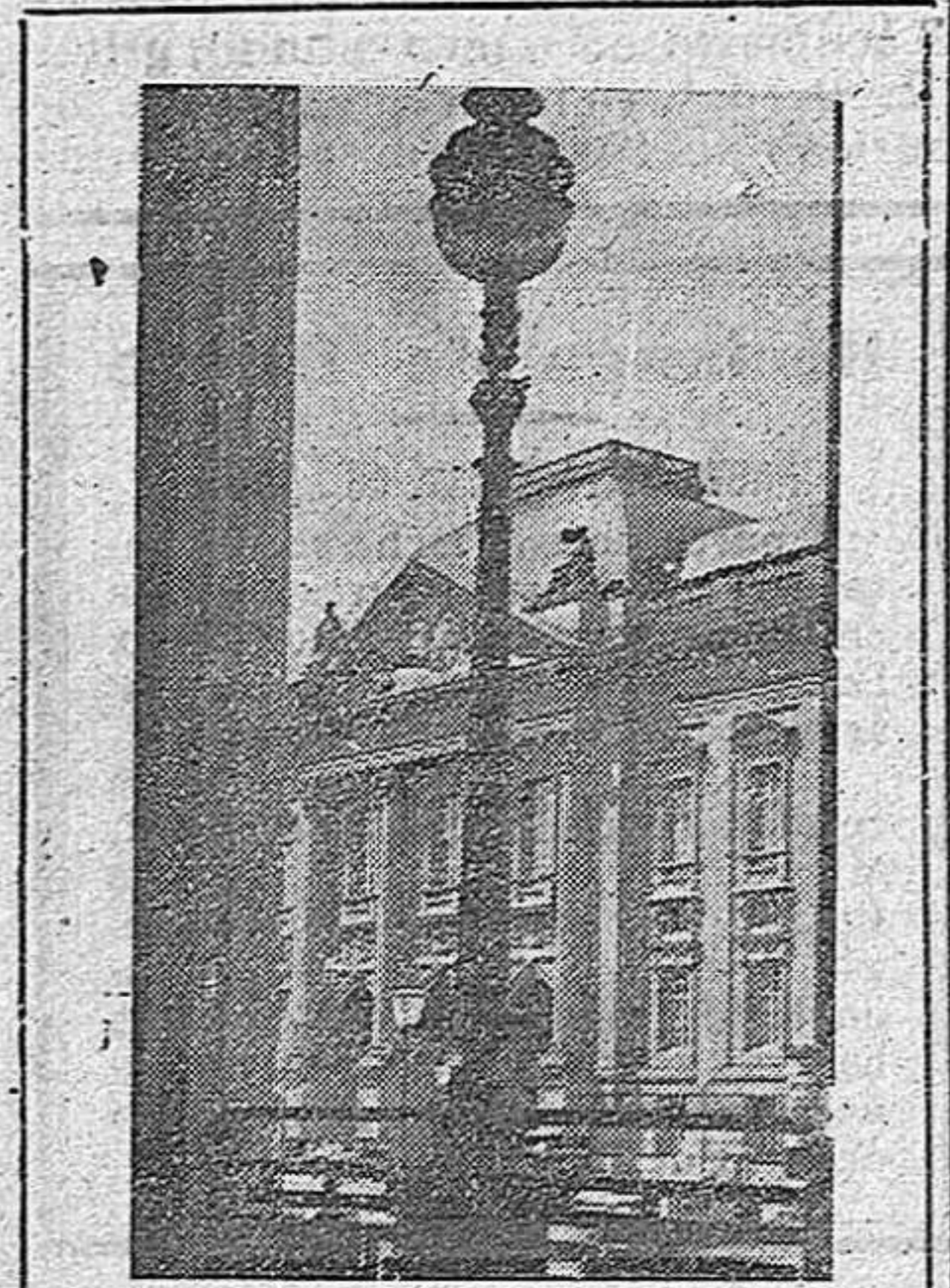
Fachada de la Biblioteca

Esta información de la venta de libros en Alemania, con su cifra tan extraordinaria solo en unos días, nos recuerda del modo más convincente, la grandiosa Biblioteca de Berlín, verdadera base de tal información, o sea del amor al libro en Alemania, demostrado del modo más práctico, con sus 21.000 biblio-