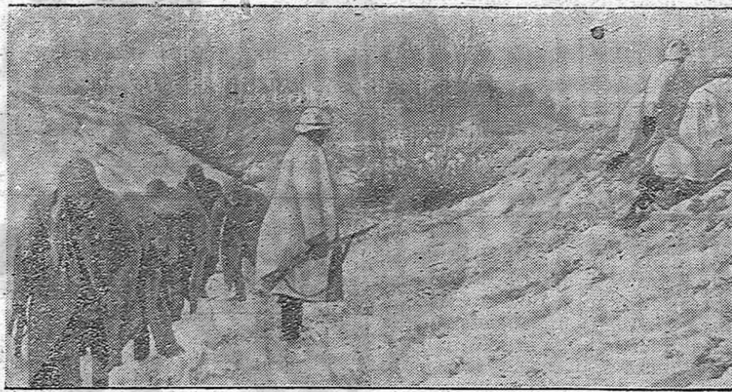
Una patrulla de reconocimiento alemana ha realizado con éxito su misión. La vuelta se hace con un grupo de prisioneros

Tokio, 2. — En aguas de las islas Marshall la flota enemiga fué atacada por la flota japonesa los nipones incendiaron un crucero y derribaron once aviones enemigos y causaron grandes daños a tres unidades enemigas. — Efe.