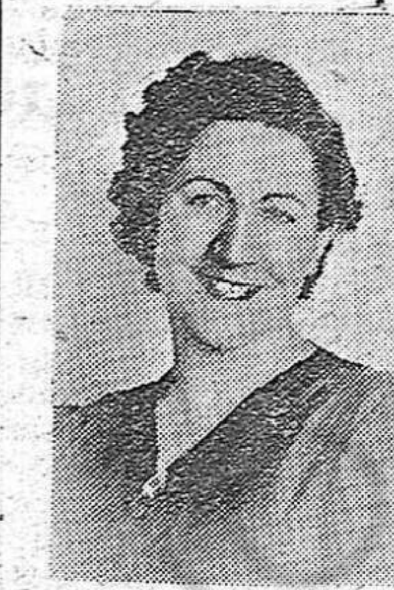
FULGENCIA ARAIZ Delegada Provincial de la Sección Femenina

La Sección Femenina ha puesto en la diáfana del alborar de España la más segura y ardiente de las flechas en un blanco difícil y conseguido. ¿Que será cuando todas las mujeres españolas adquieran esa formación que sueña la Delegada Nacional?