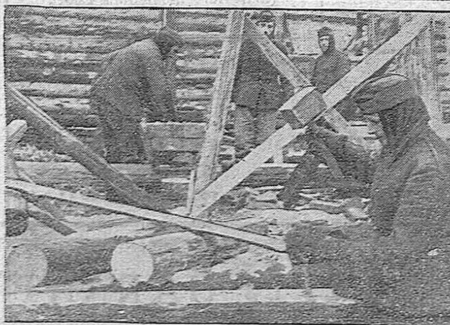
Detrás de la primera línea, construyen los soldados alemanes sus refugios para el invierno