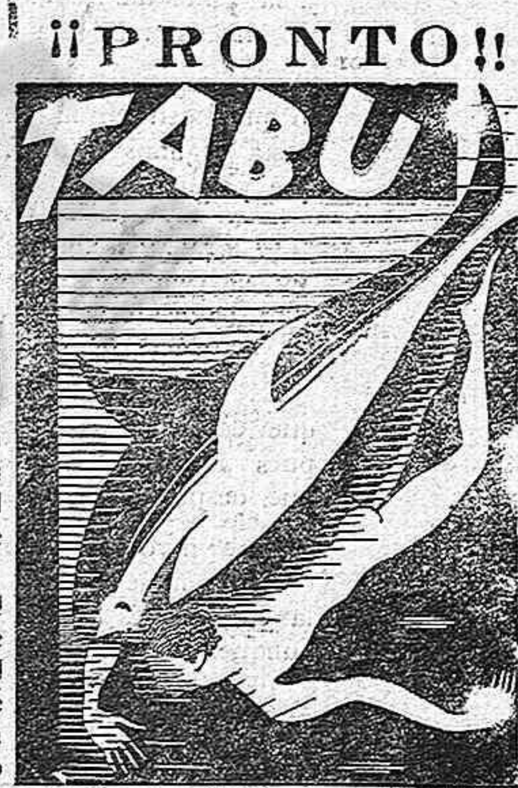
Una de las más grandes producciones del cinema.