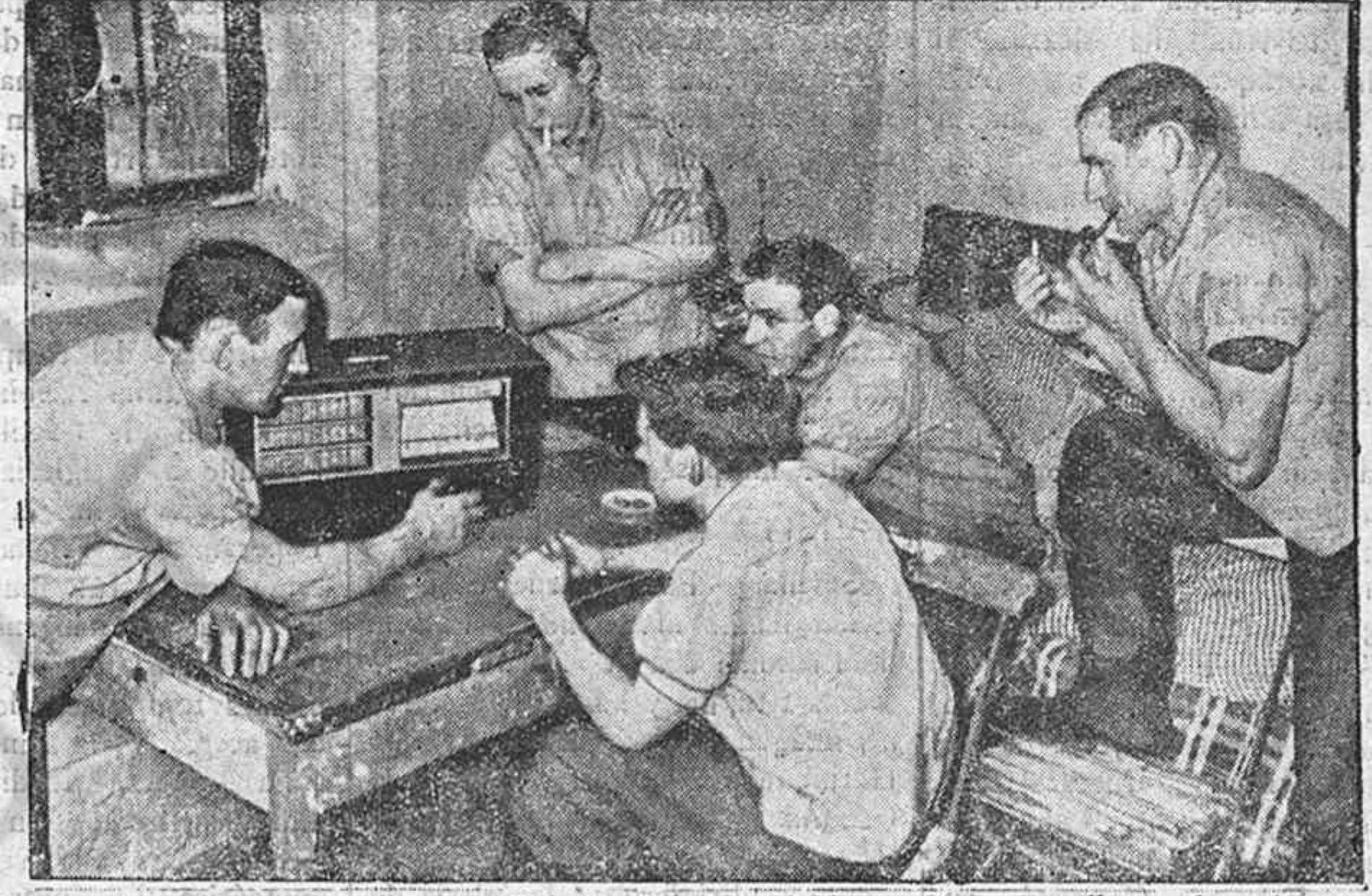
El pueblo alemán oye con emoción a su Führer.—Durante el último discurso millones de radioescuchas alemanes oyen atentamente la voz de su Führer por radio..

ron parte en él sólo dijo que había sido "más del doble de los aviones alemanes que atacaron el sábado la base naval de Scapa Flow". Como se recordará, según declaraciones inglesas, los aparatos alemanes que bombardearon Scapa Flow fueron catorce. También dijo el ministro que durante el ataque de la aviación británica sobre la isla de Sylt, varios hangares fueron alcanzados e incendiados por las bombas de los aparatos ingleses. "Algunos depósitos de petróleo—añadió— fueron incendiados también, y el bombardeo causó daños en diversas partes de la isla. Los nuevos reconocimientos efectuados han confirmado el éxito de los raids". Wood subrayó que todos los