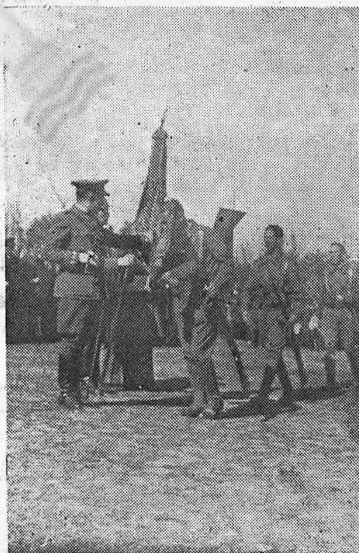
Los alumnos de la Academia de Fuentecaliente besan la Bandera de la Patria