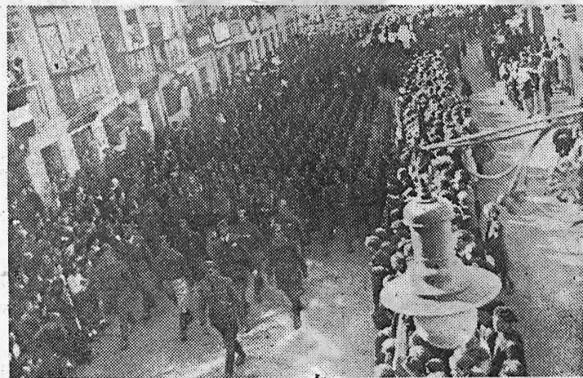
El Batallón de Sargentos desfilando en columna de honor