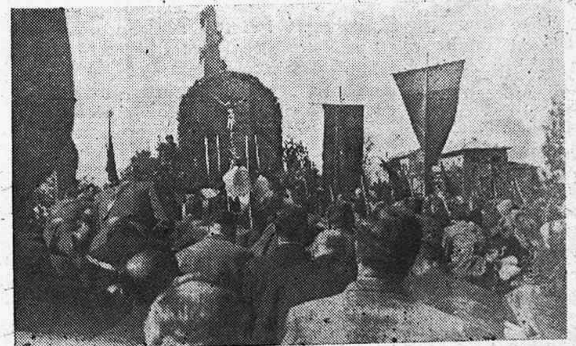
Misa de campaña.—Momento de alzar