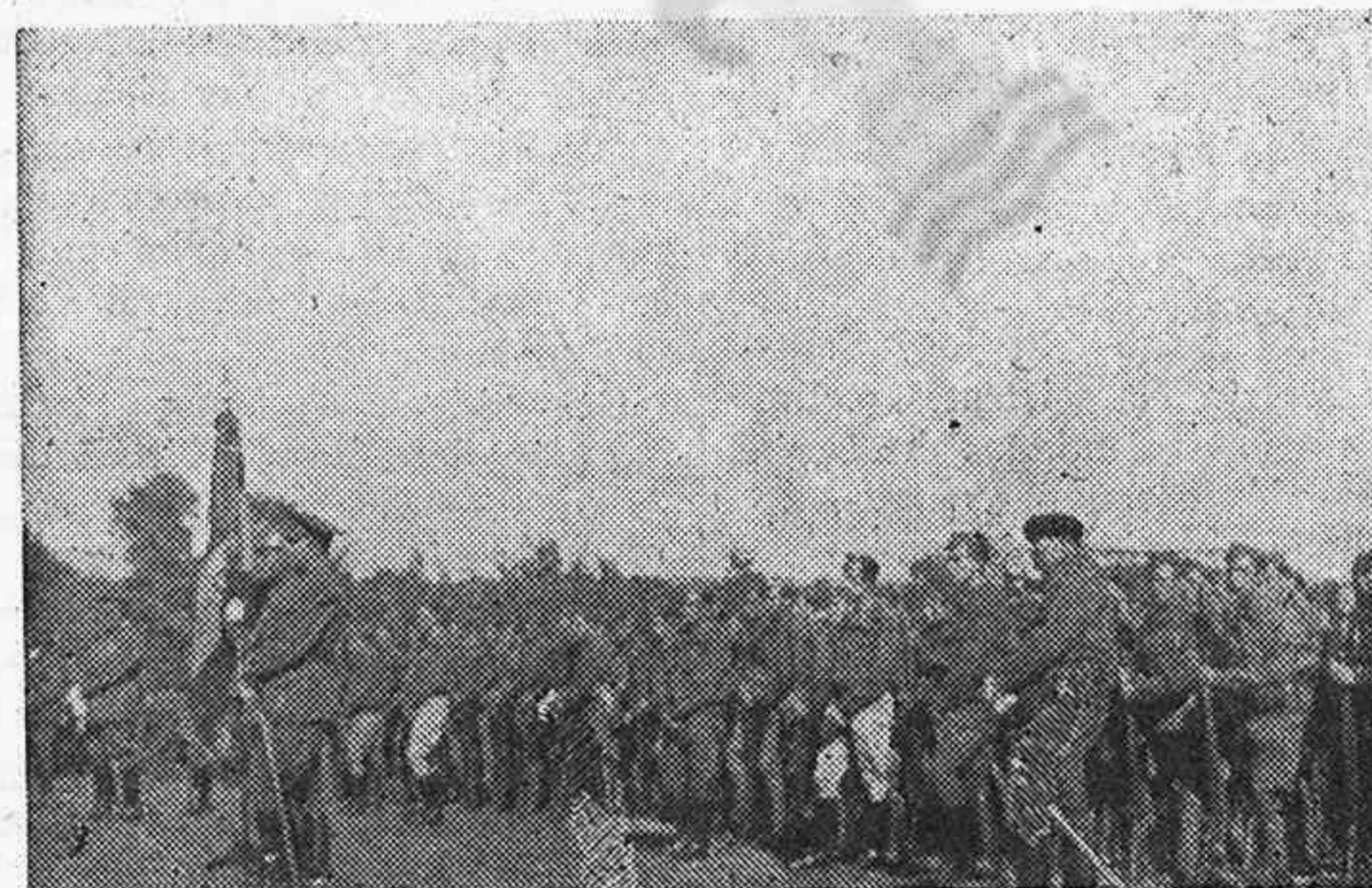
Compañía del Regimiento de Aragón con su Bandera