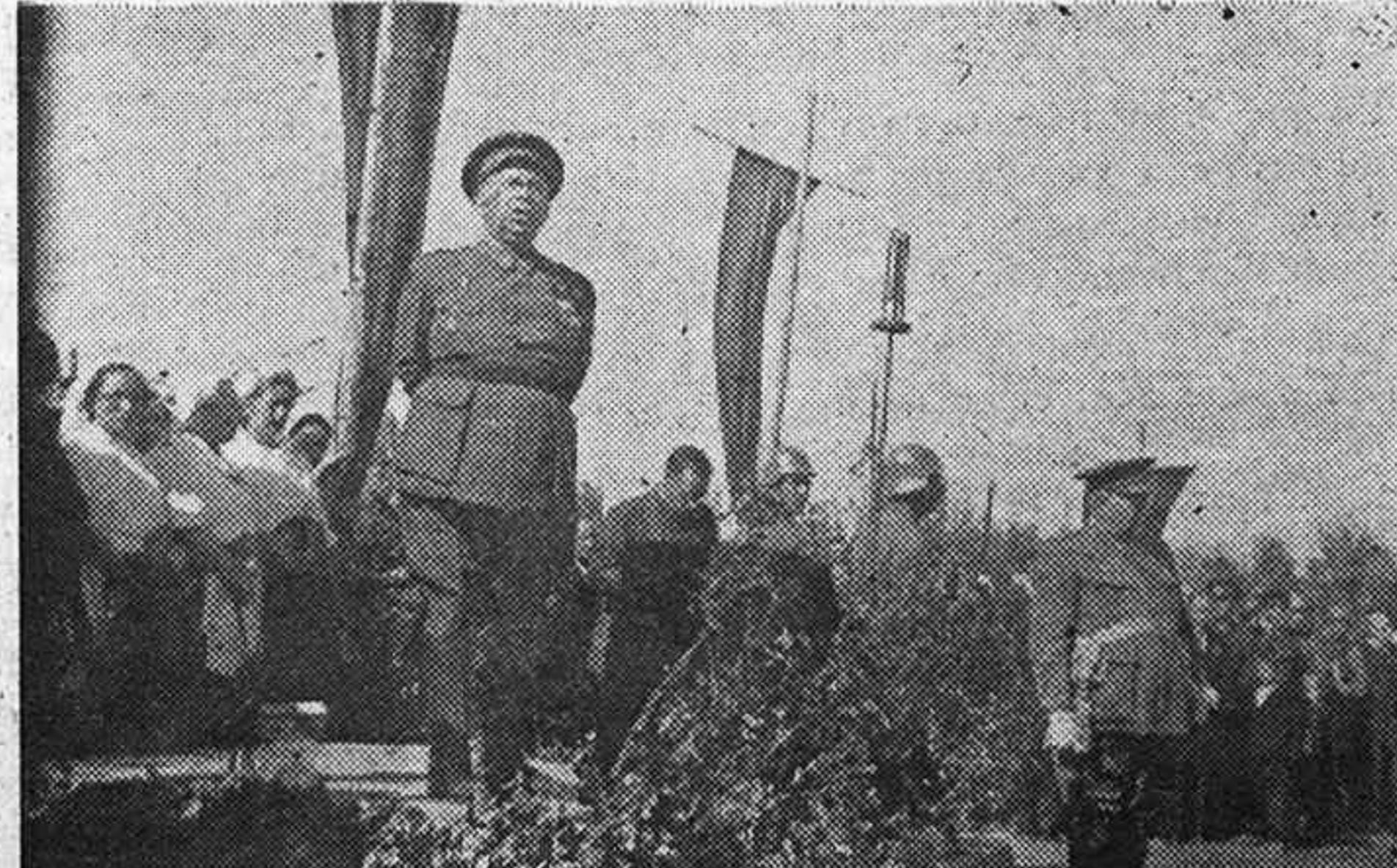
El General Orgaz dirigiendo patriótica arenga, a las tropas y al pueblo