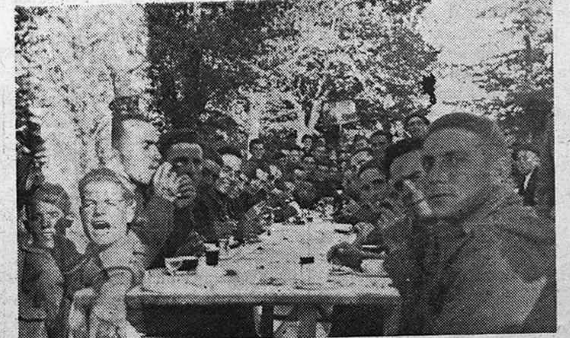
FIESTA DE LAS CALDERAS Una mesa de alegres comensales