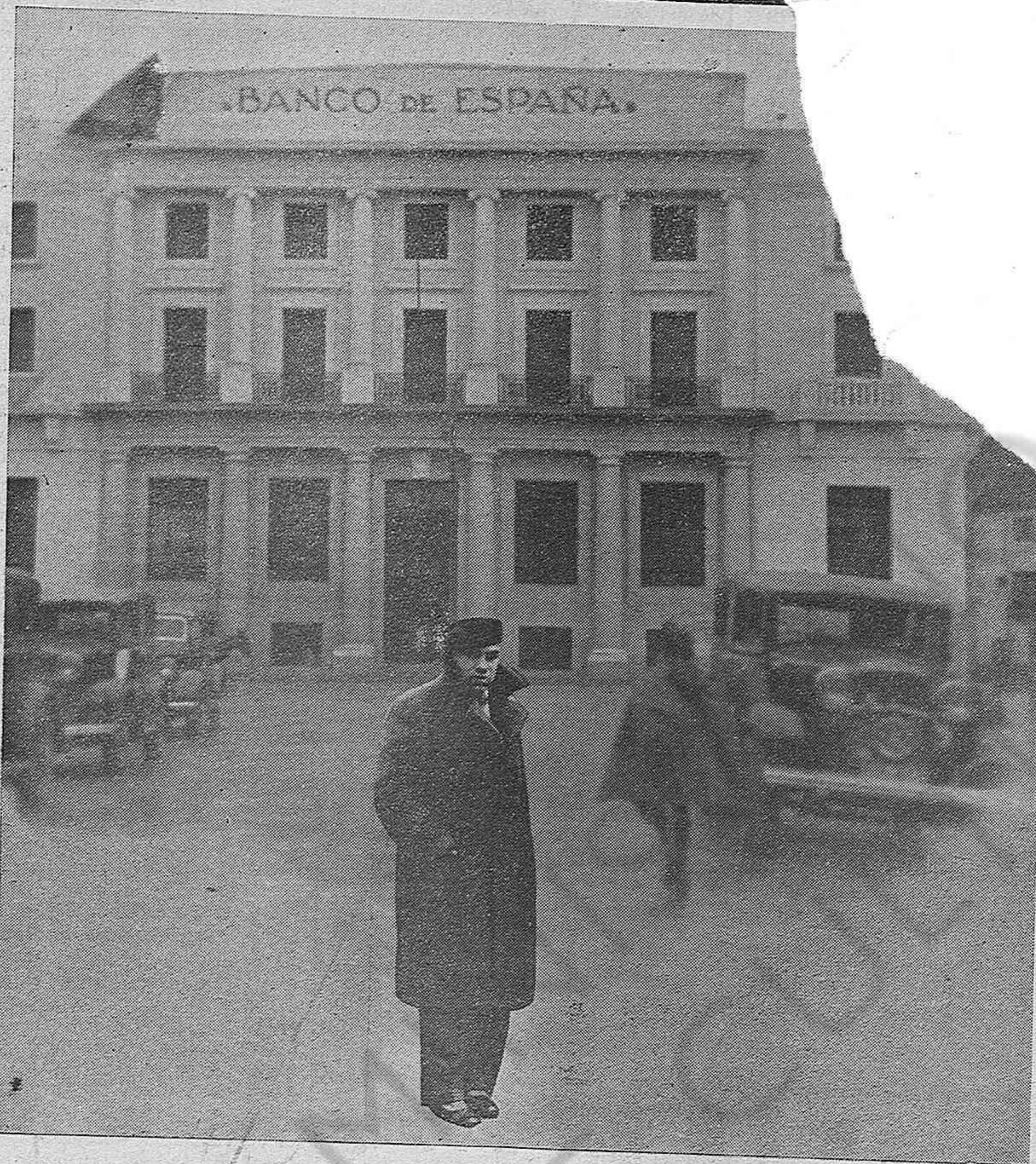
El famoso boxeador Paulino Uzcudun en la Plaza de la República, ante la magnífica Sucursal del Banco de España que en breve será inaugurada.