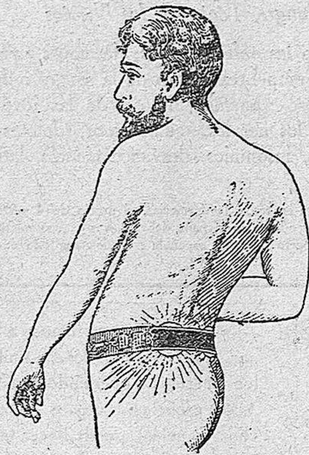
Marca registrada. Núm. 28.457