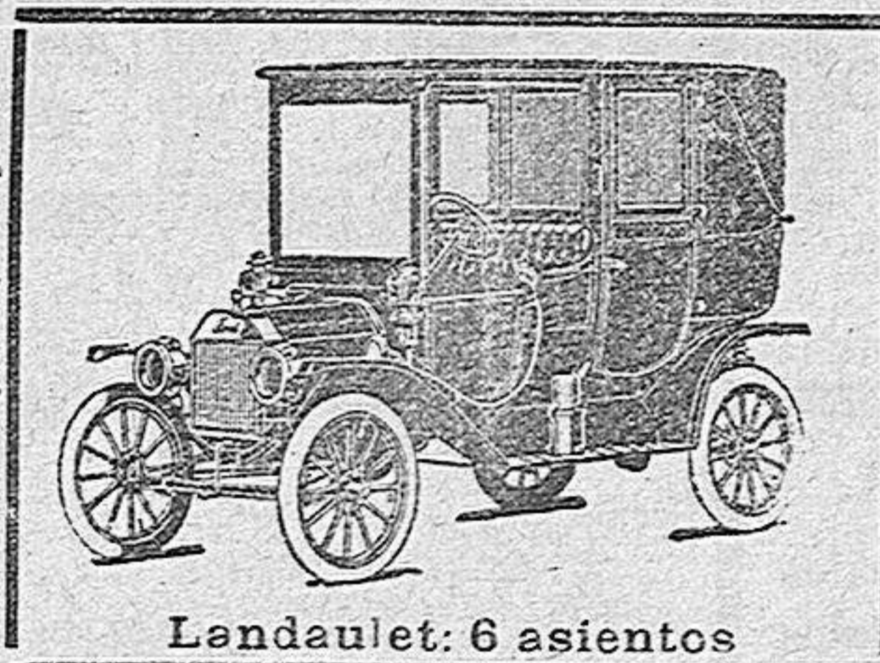
Landaulet: 6 asientos