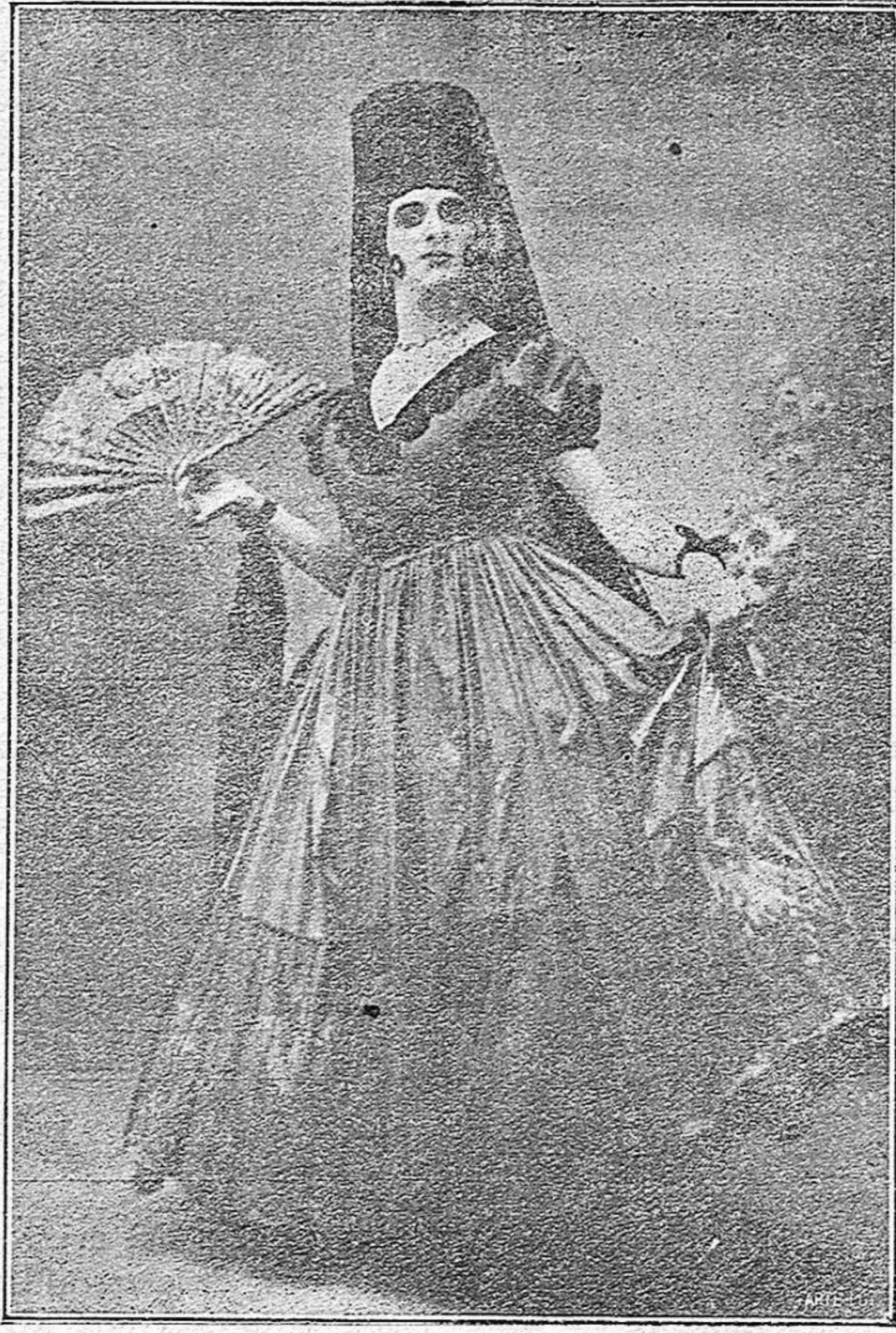
El celebrado artista Foliers, que ayer debutó con gran éxito en Parisiana.