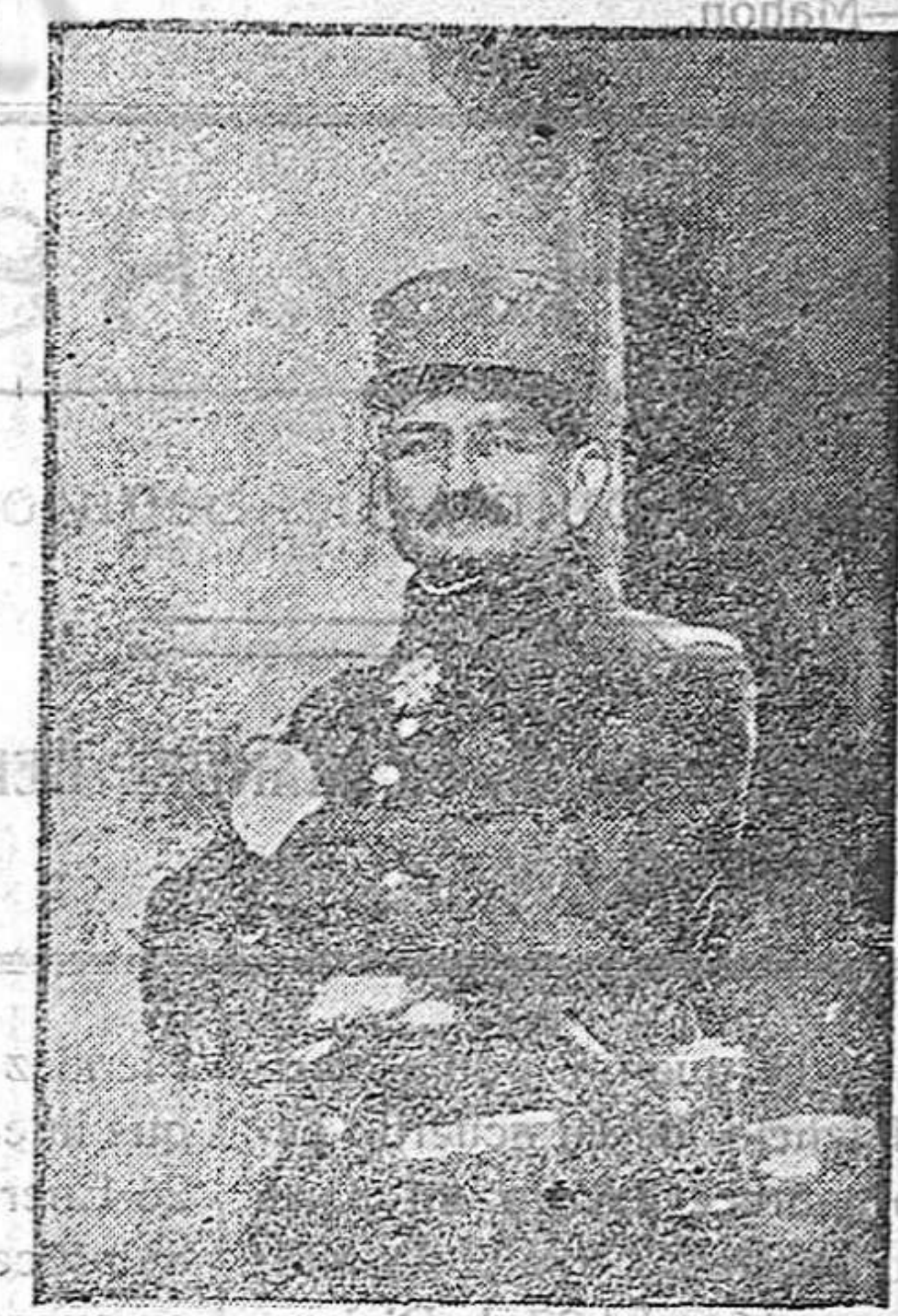
LA GUERRA EUROPEA.—El general Mangin

Cada ejemplar sólo tiene opción a un premio.