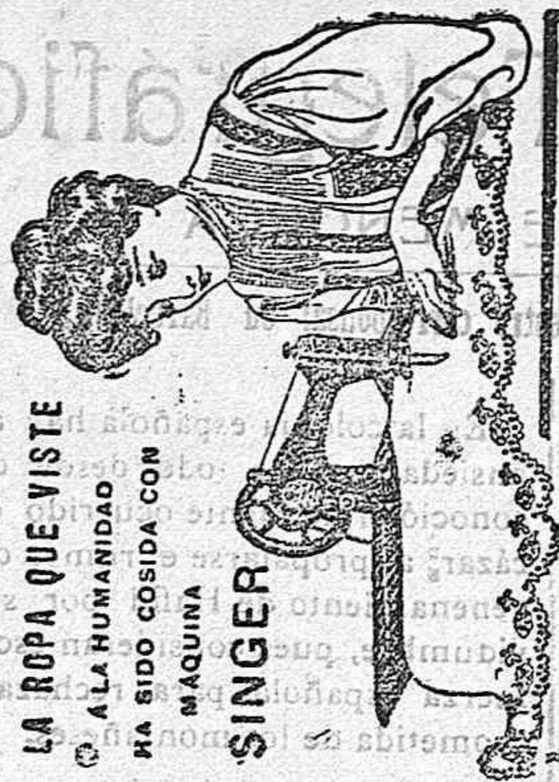
LA ROPA QUE VISTE

En primera plana doble precio que el señalado en tarifa. A los suscriptores se les hace un 25 por 100 de rebaja