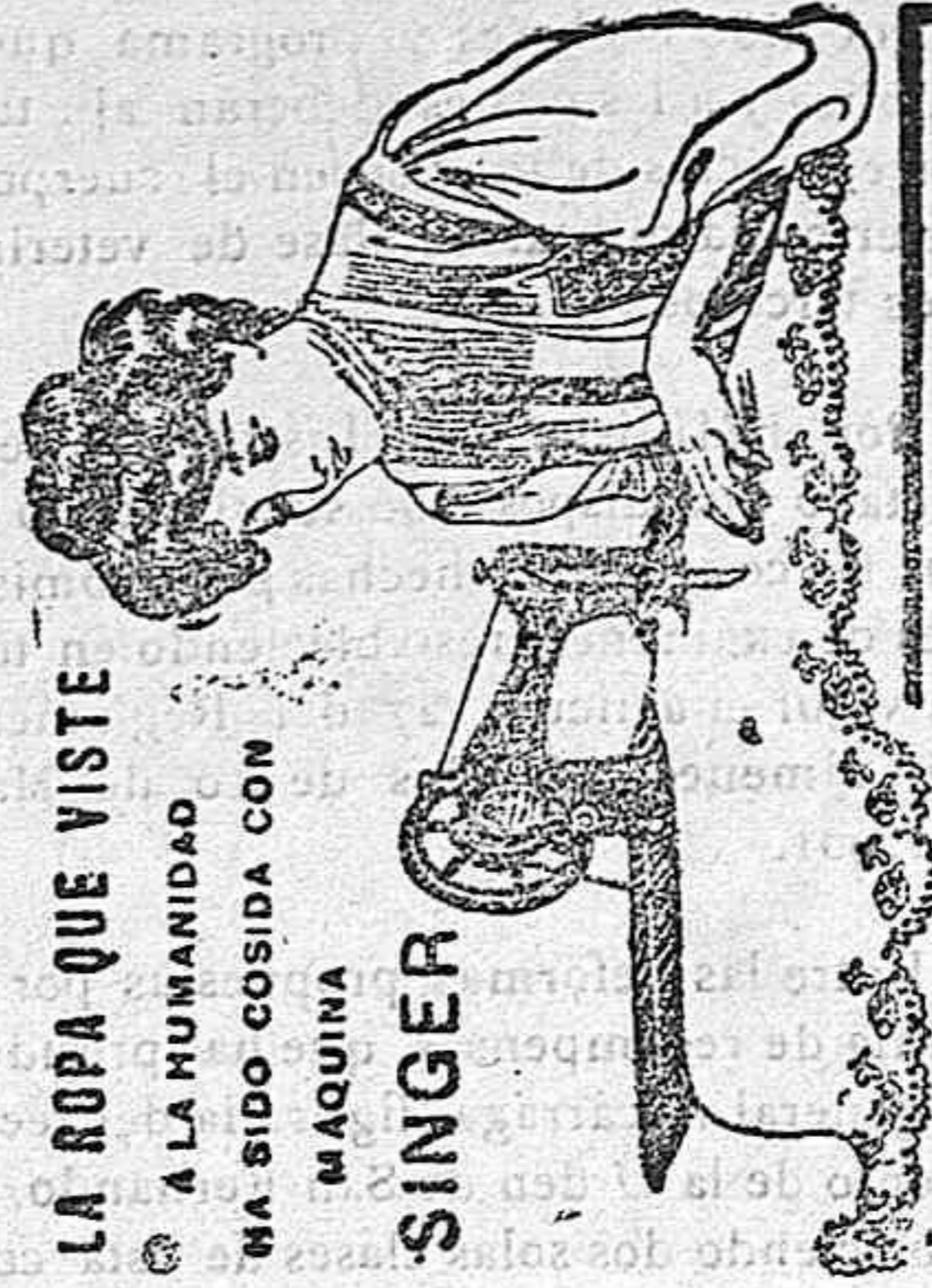
LA ROPA QUE VISTE A LA HUMANIDAD HA SIDO COSIDA CON MAQUINA SINGER

A los suscriptores se les hace un 25 por 100 de rebaja.