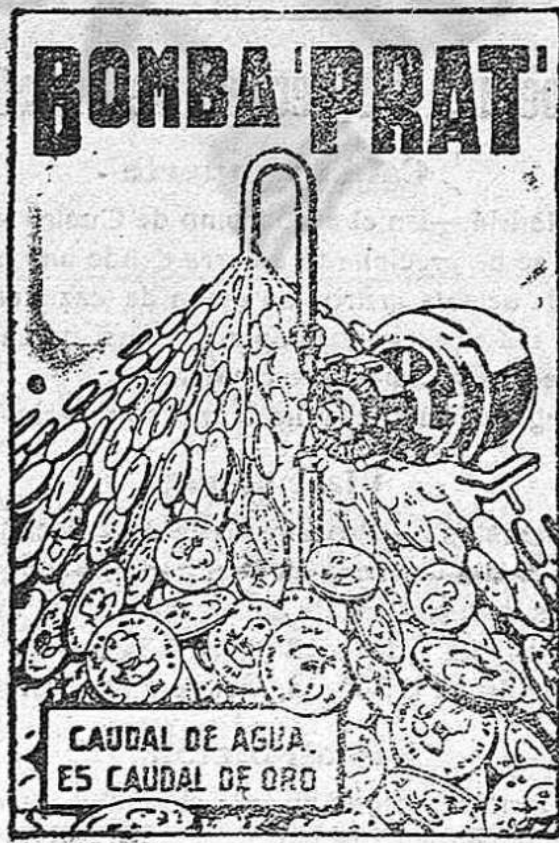
CAUDAL DE AGUA ES CAUDAL DE ORO

AGUA A COMODIDAD, SIN GASTES NI INTERRUPCIONES, Y CON UN CONSUMO DE FLUIDO INSIGNIFICANTE