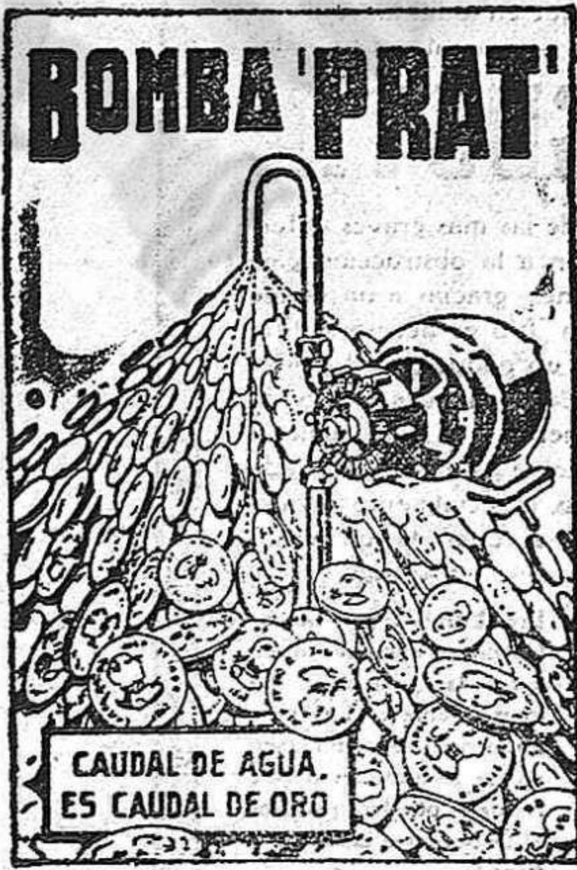
CAUDAL DE AGUA ES CAUDAL DE ORO