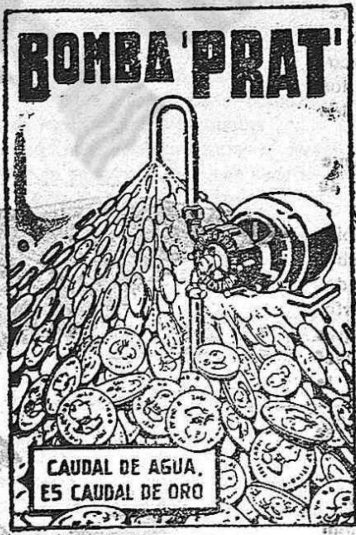
CAUDAL DE AGUA, ES CAUDAL DE ORO

AGUA A COMODIDAD, SIN DES- GASTES NI INTERRUPCIONES, Y CON UN CONSUMO DE FLUIDO INSIGNIFICANTE