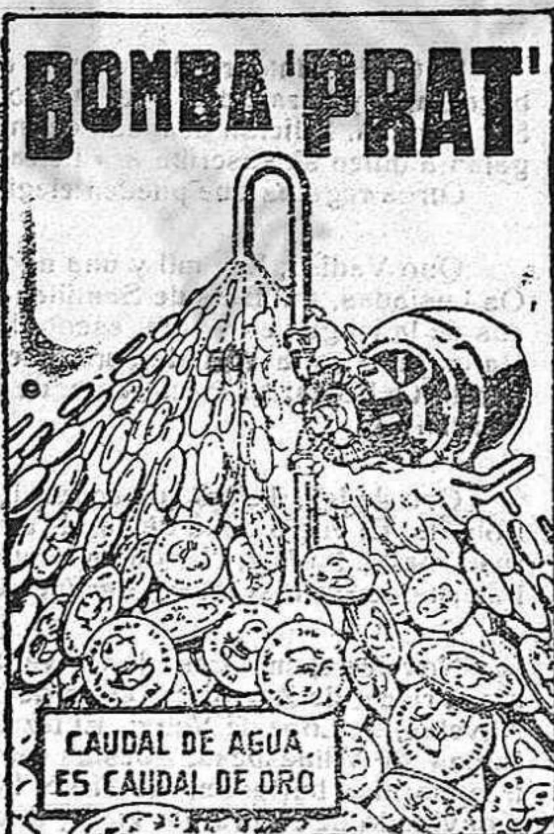
CAUDAL DE AGUA ES CAUDAL DE ORO

AGUA A COMODIDAD, SIN GASTES NI INTERRUPCIONES, Y CON UN CONSUMO DE FLUIDO INSIGNIFICANTE