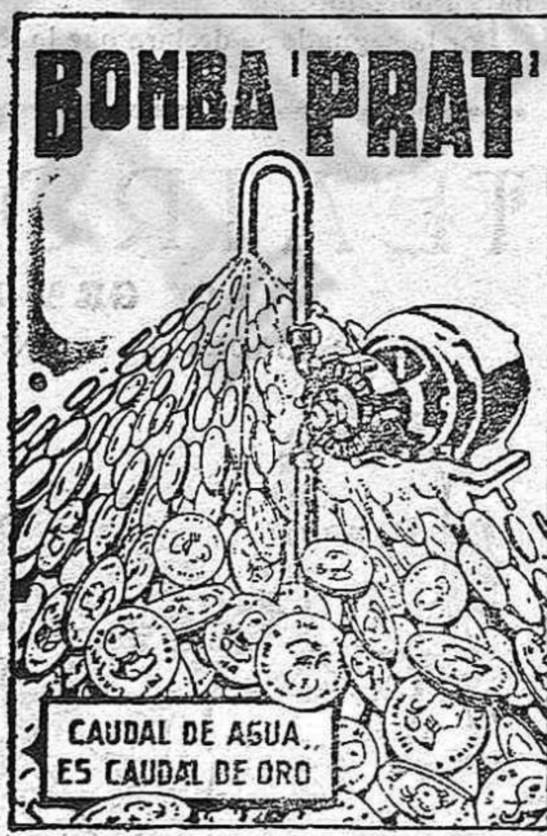
CAUDAL DE AGUA ES CAUDAL DE ORO

AGUA A COMODIDAD, SIN GASTES NI INTERRUPCIONES, Y CON UN CONSUMO DE FLUIDO INSIGNIFICANTE