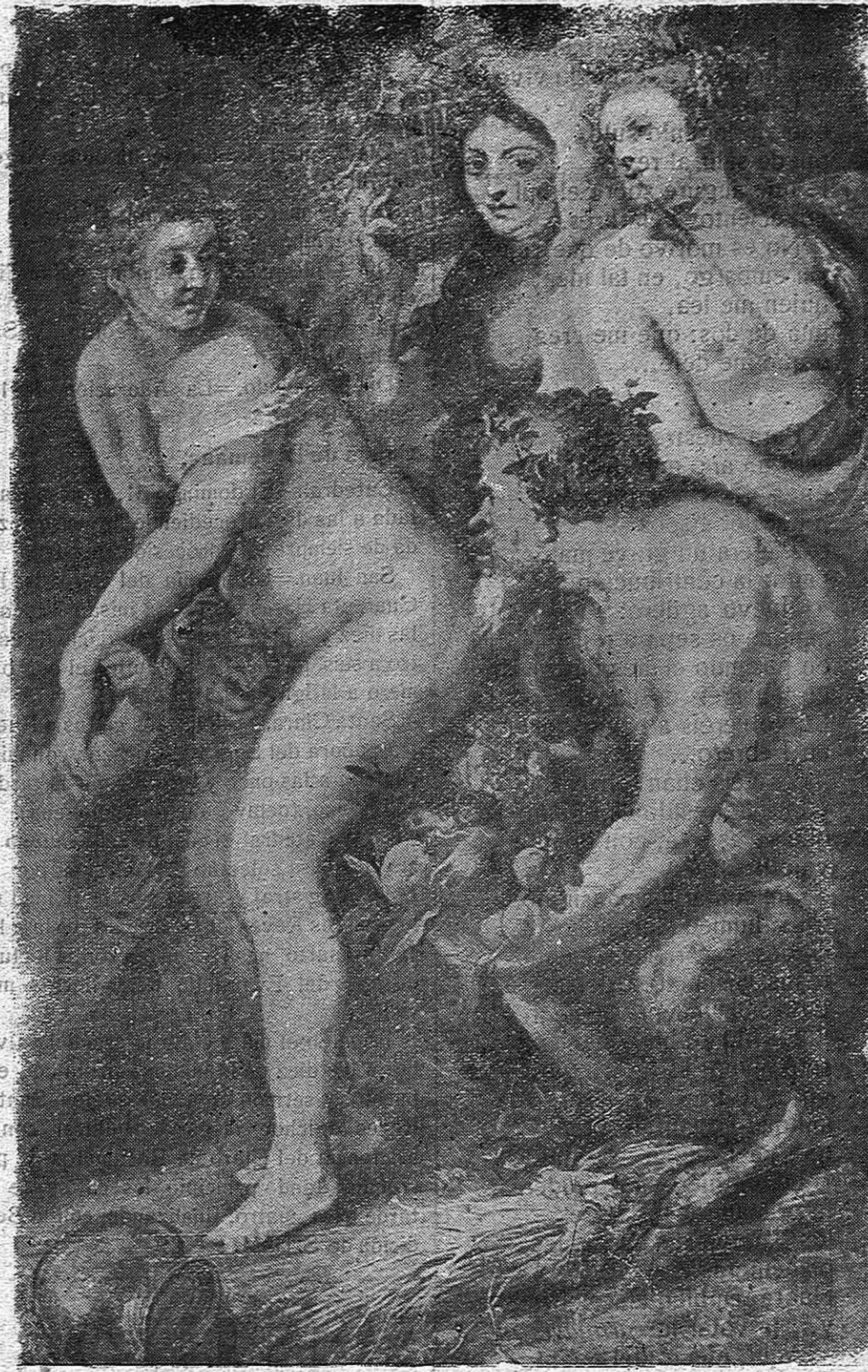
P. P. RUBENS.—Venus en la fragua de Vulcano

Pedro Pablo Rubens, el gran pintor, el hábil diplomático y exquisito cortesano, pintó esta magnífica alegoría del Verano en su espléndido cuadro «Venus en la fragua de Vulcano».