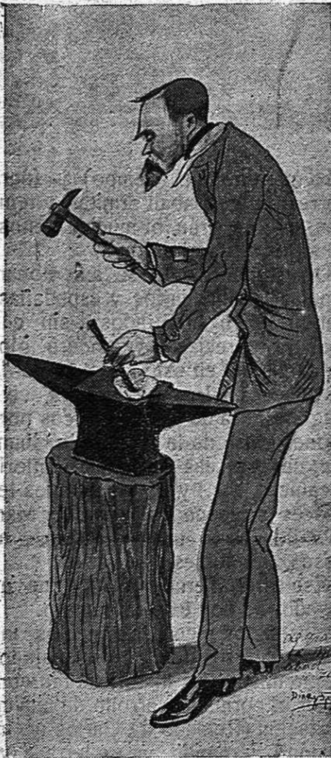
El maestro Matías Abad

La vieja tradición dió un salto de cinco siglos para llegar hasta él y las verjas de la catedral (portada) y San Pedro (coro), hablan de este salto con gran elocuencia.