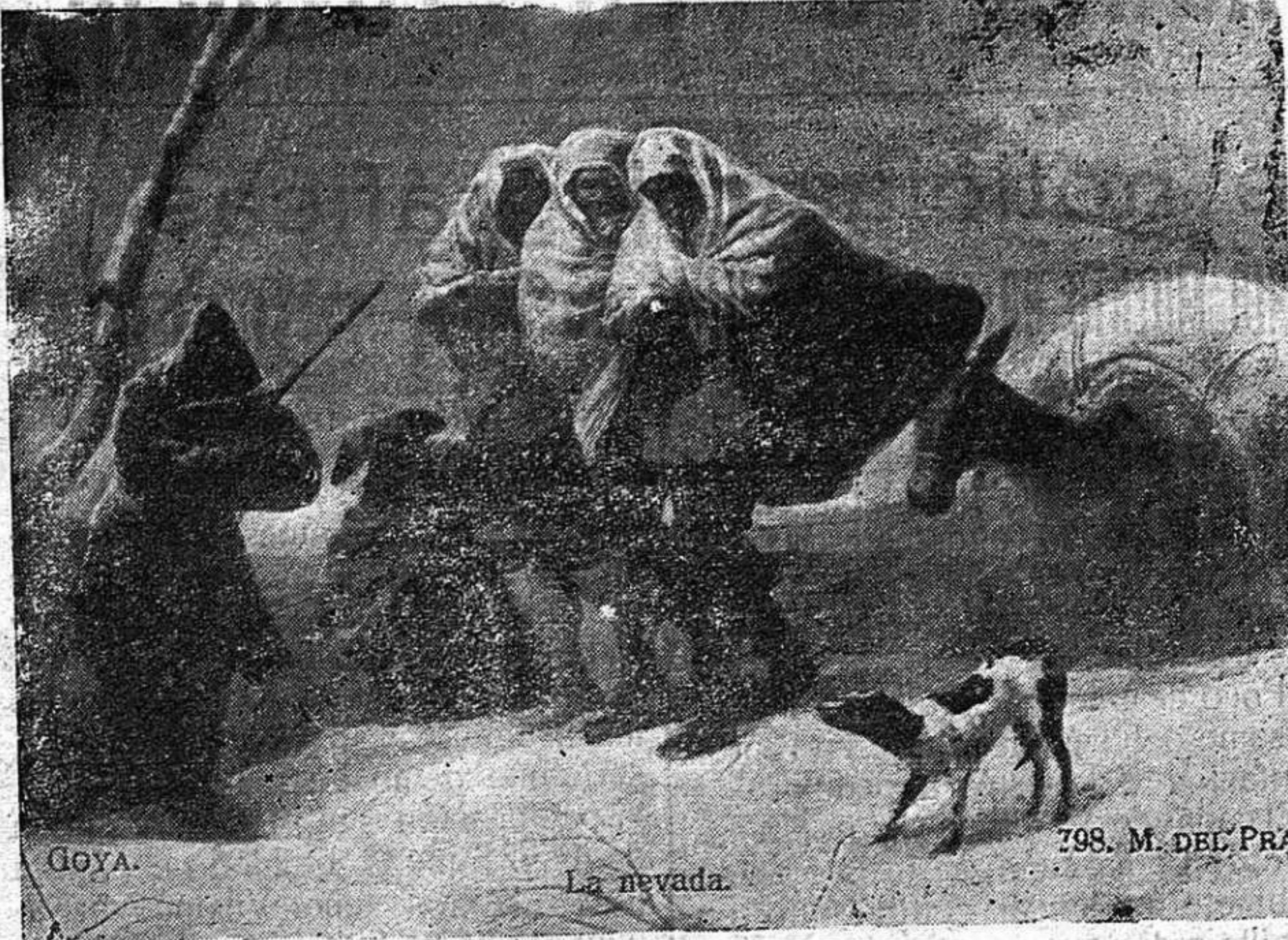
GOYA.—La nevada Museo del Prado

Nadie como D. Francisco de Goya supo interpretar el alma del pueblo. Acaso porque vivió en los tiempos de máximo despolitismo y junto a una corte cuyos ejemplos no eran ciertamente los más edificantes, supo medir la distancia que separaba a los opulentos de los humildes, a los opresores de los oprimidos, a los petimetres y pisaverdes (descendientes de los hindos del siglo XVII y precursores de nuestros pollos bien) de los hijos del trabajo. Desde esa magnífica página de la historia que se llama «La Familia de Carlos IV», a cualquiera de los cartones con escenas populares majas, chisperos, etc., está toda la gama de la sociedad española de aquel tiempo. En esta «nevada» en esta alegoría del invierno, están los fuertes, los hijos del trabajo que se apinan para luchar contra el frío. Estos fueron los que resistieron al francés, los que vertieron su sangre por la patria; los otros, los cortesanos y pisaverdes, fueron los que, en Bayona, sirvieron de bufones a Napoleón. ¿Quizá no valiesen para otra cosa!