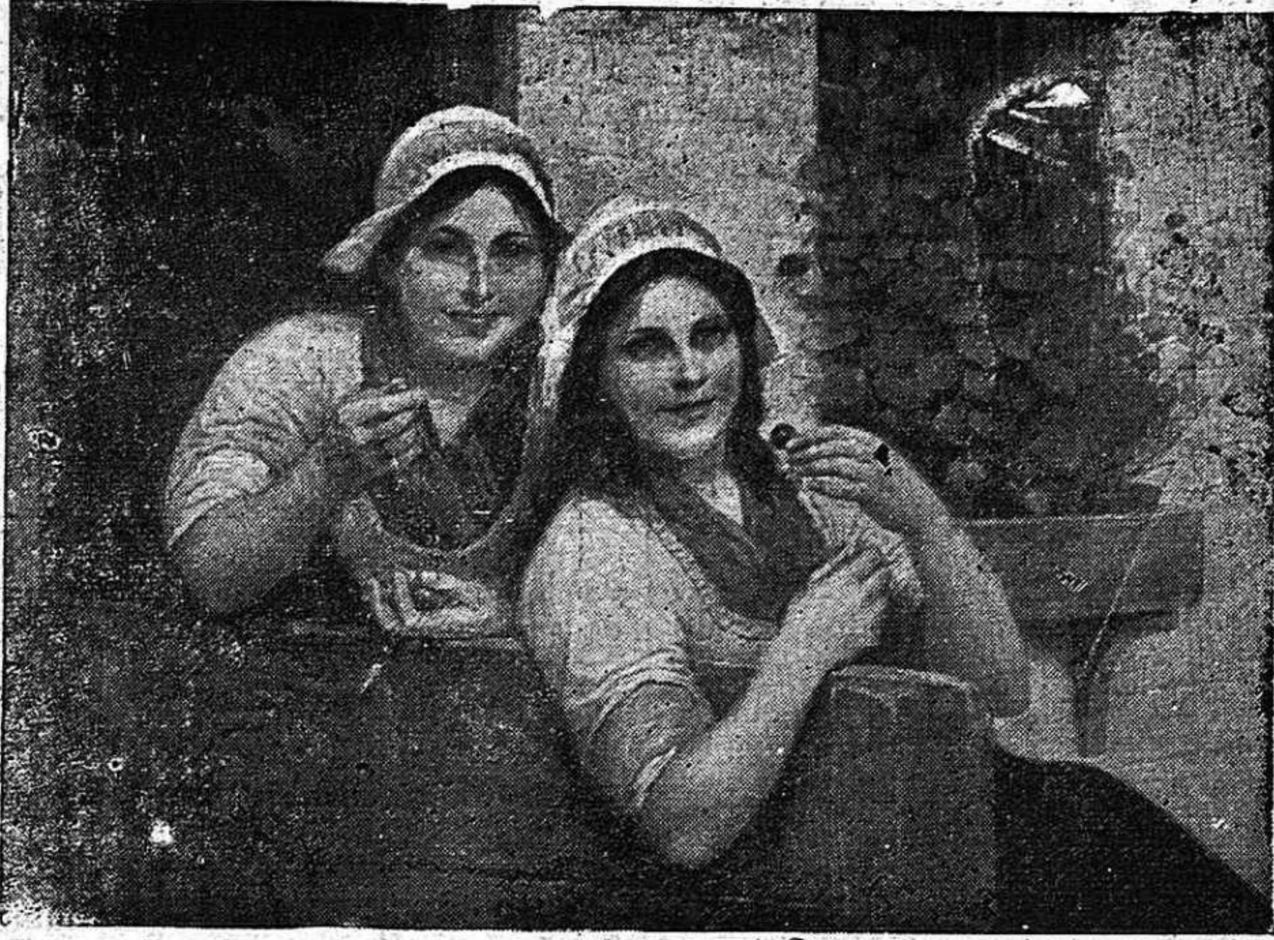
BOURIE.—Las cerezas maduras Museo de Gante

Una joya de la pintura contemporánea, de esa pintura que ha sabido defenderse de extravagancias decadentes, siguiendo atada a una bella tradición y al mismo tiempo avanzando hacia legítimas modernidades.