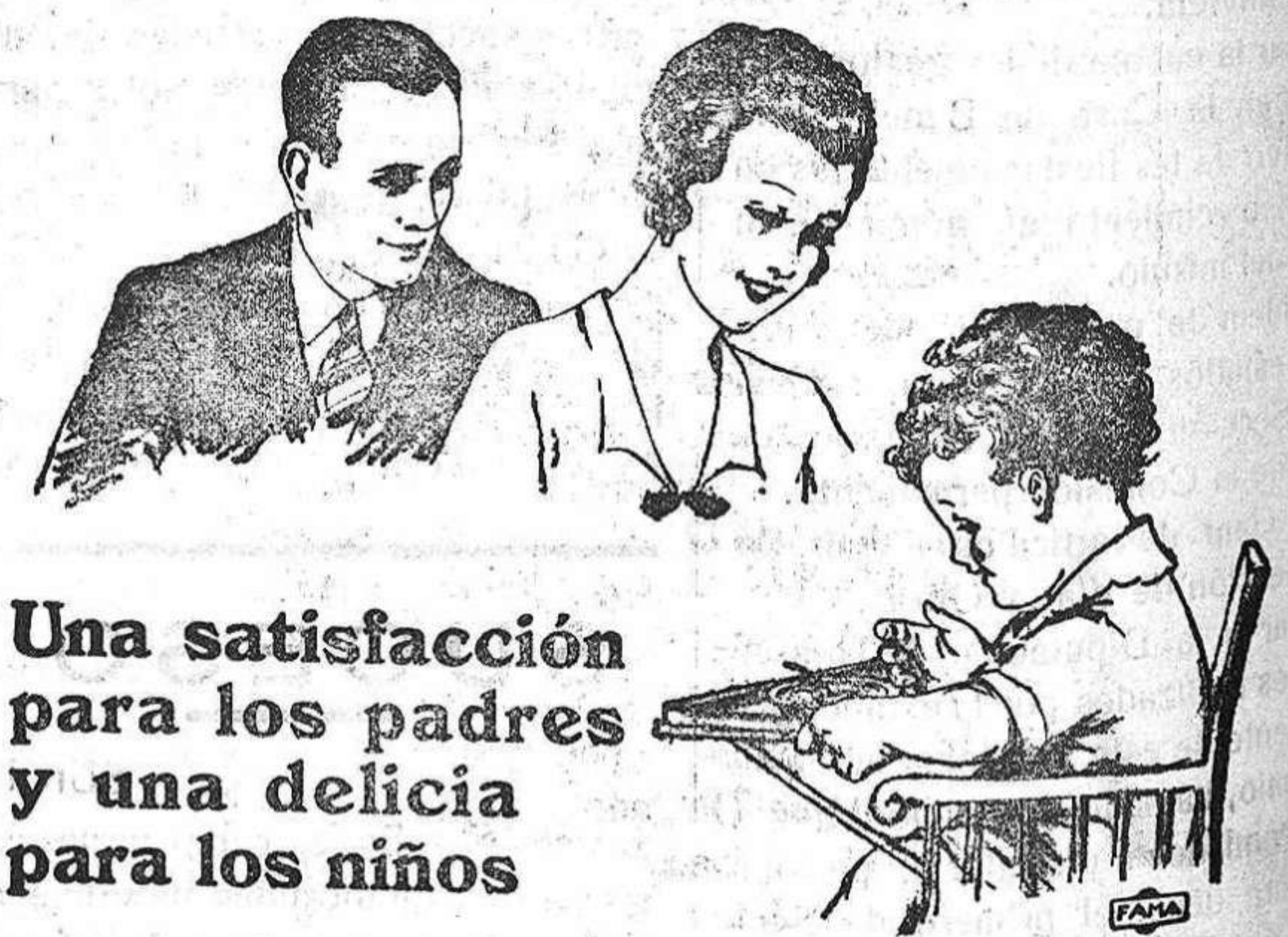
para gozar de la perfecta salud.

Una satisfacción para los padres y una delicia para los niños