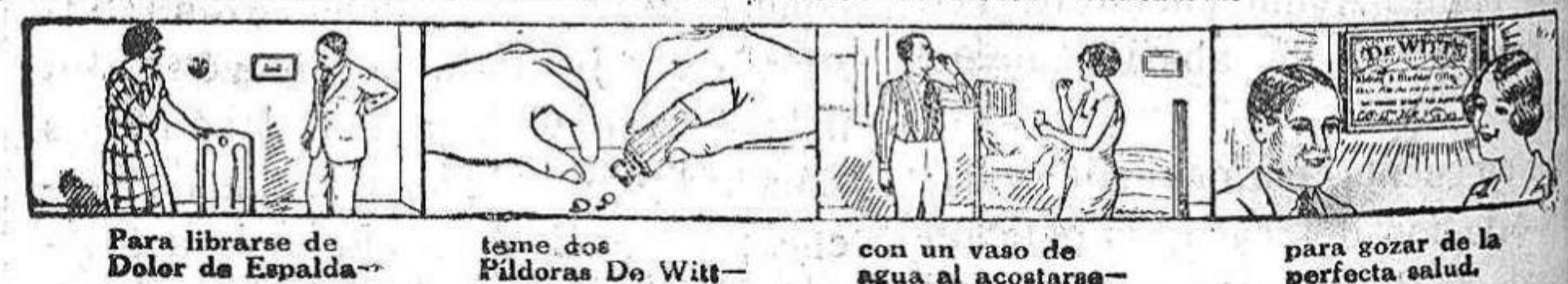
Para librarse de Dolor de Espalda--

Unas horas después de haber tomado la primera dosis de Píldoras De Witt el cambio de color de la orina le dará a comprender que la preparación ya ha principiado su buena obra. Estará Vd. en condiciones de observar que los ingredientes limpiadores, curativos y fortalecedores de las Píldoras De Witt han pasado a través de sus Riñones y Vejiga. No existe otro medicamento que le dé una prueba parecida, y cuando haya Vd. ensayado las Píldoras De Witt se arrepentirá de que no las hubiera tomado antes. Tómelas para Dolores de Arterias, Arteritis, Cálculos, Cuyanturas dolorosas, Rigidez, Reumatismo, Dolores en la Espalda, Lumbago y Ciática. Délas a los niños que están predispuestos a orinarse en la cama y a las personas adultas afectadas por Desórdenes Urinarios, y en todos los casos causarán alivio rápido y serán de efectos duraderos.