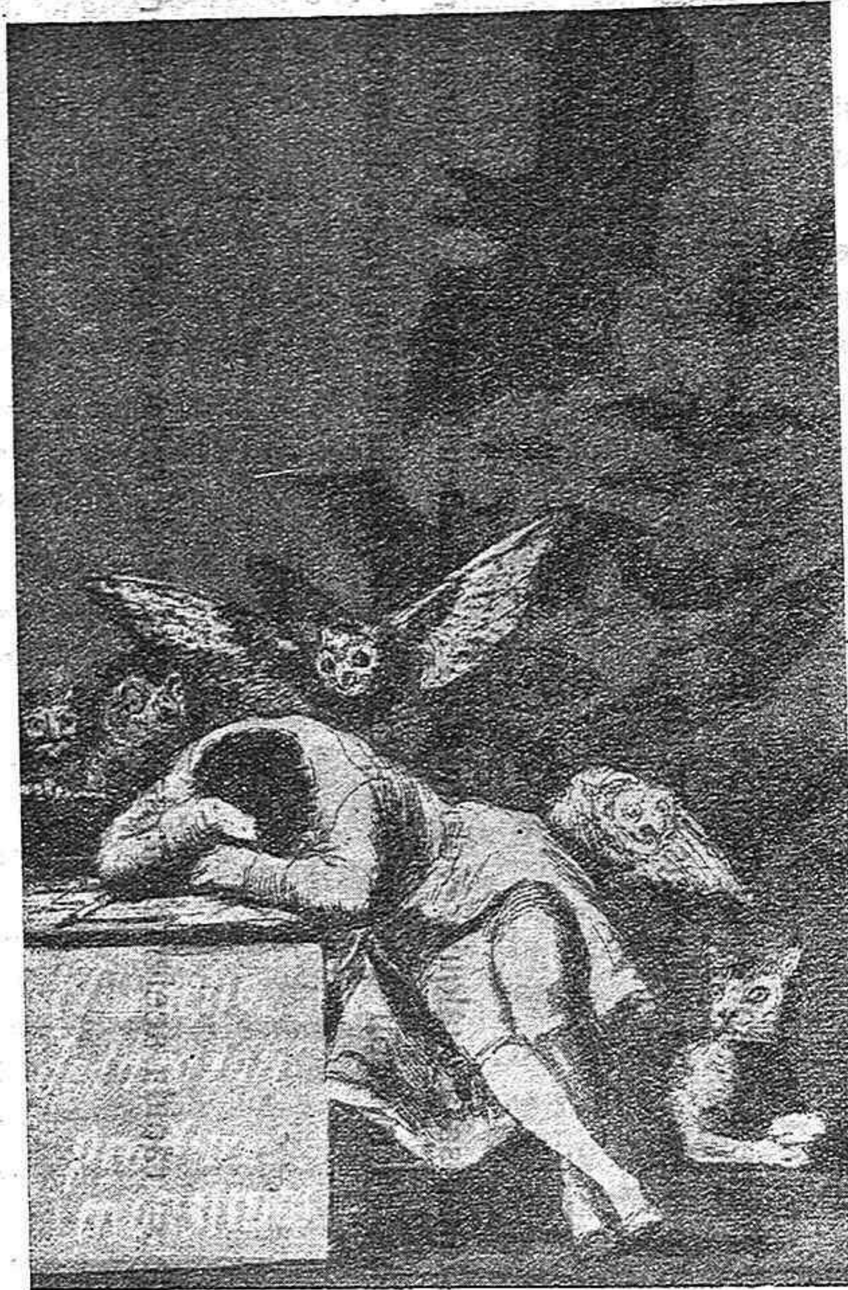
«El sueño de la razón produce monstruos».