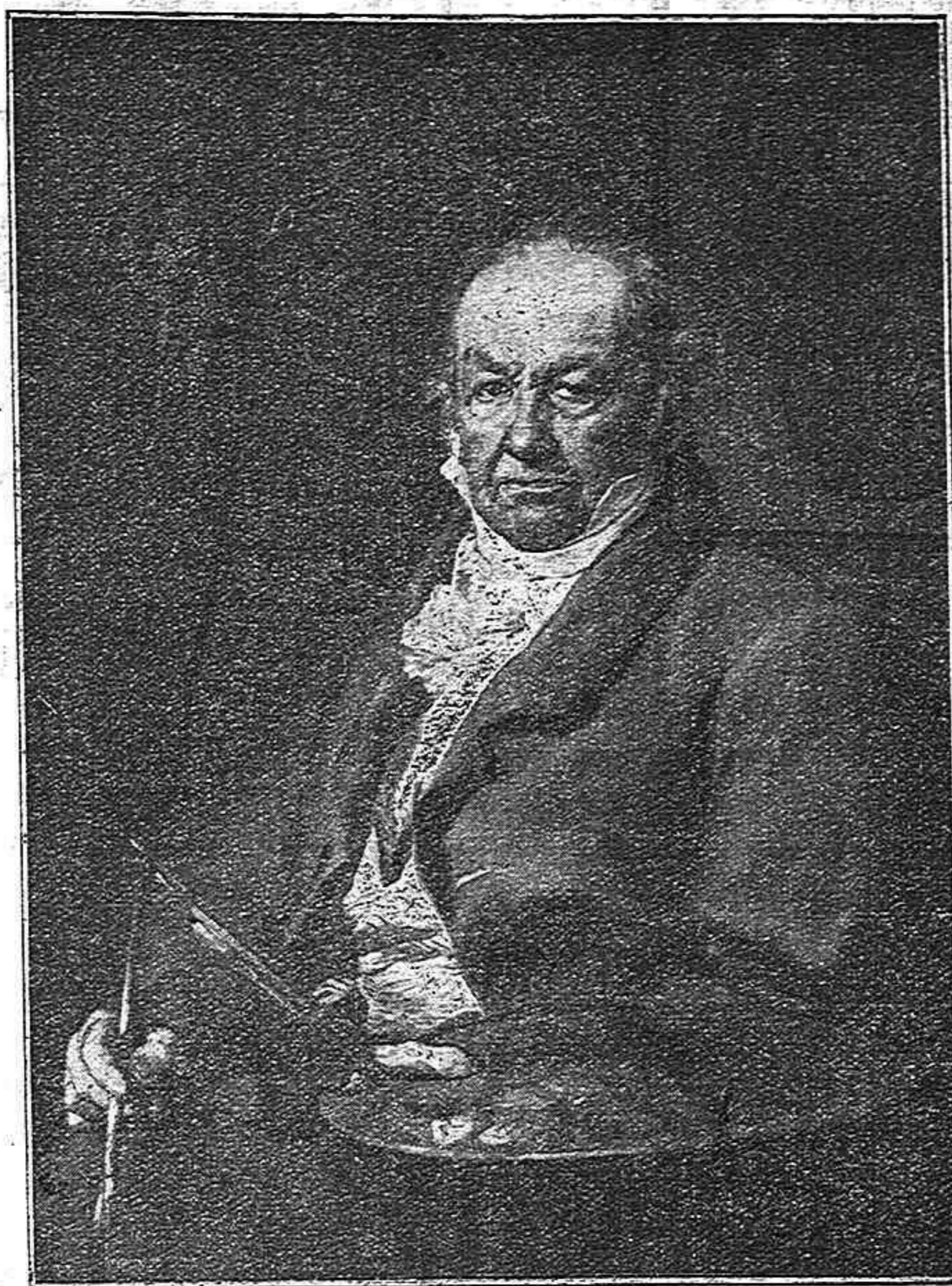
Don Francisco de Goya y Lucientes