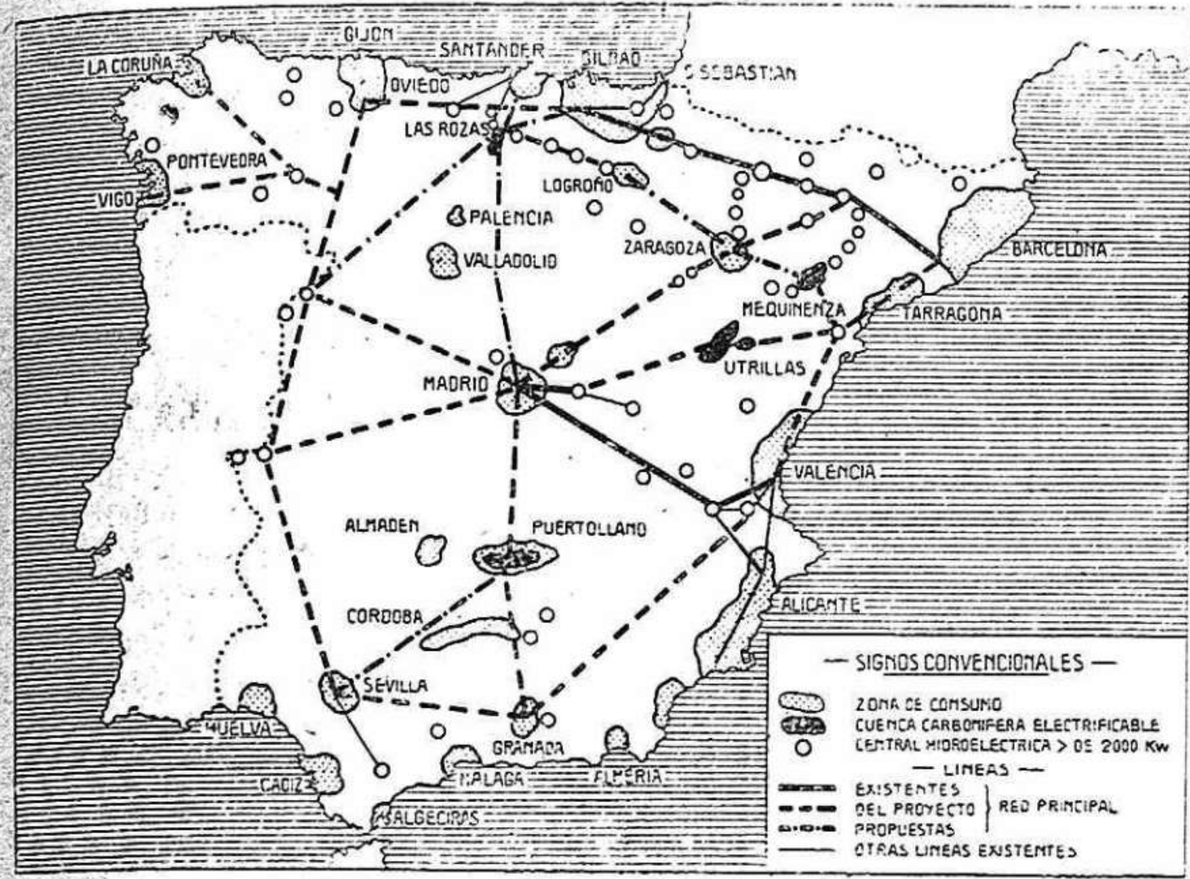
Figura 1. a

Según el proyecto, la red consiste esencialmente en una línea general periférica de la cual forma parte el gran colector pirenaico. Los saltos fronterizos del Tajo y del Duero en proyecto, y los del Júcar, Catuel y Gualdiela en explotación, están unidos con Madrid, que constituye su principal mercado, por líneas radiales, alguna de las cuales como la del Molinar, está construida ya.