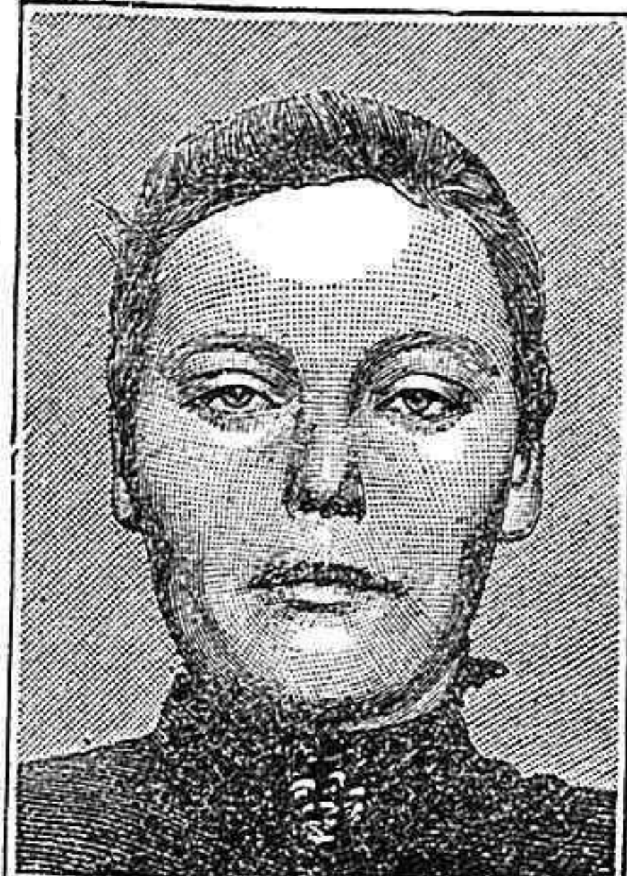
Después de 10 días de curación