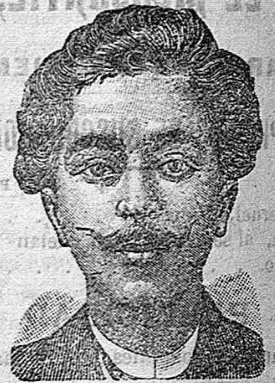
Después de 10 días de curación