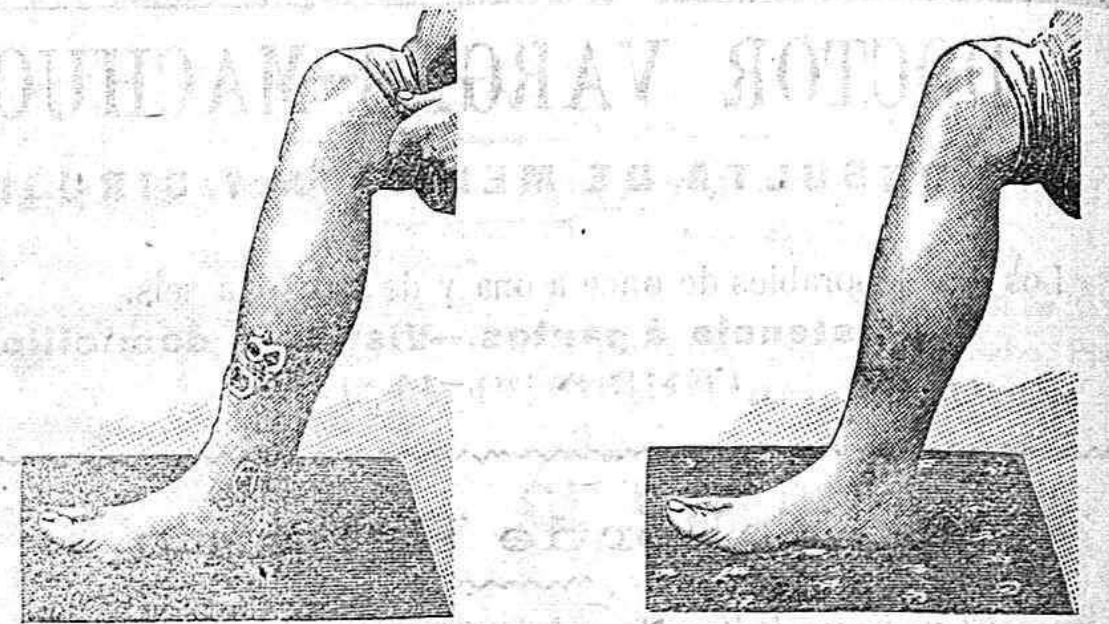
Antes de la curación Después de 30 días de curación

cura radical de todas las enfermedades de la piel y lasple nas y del artrismo, reumatismo gota, dolores etc. por medio del TRATAMIENTO DEL RICHELET