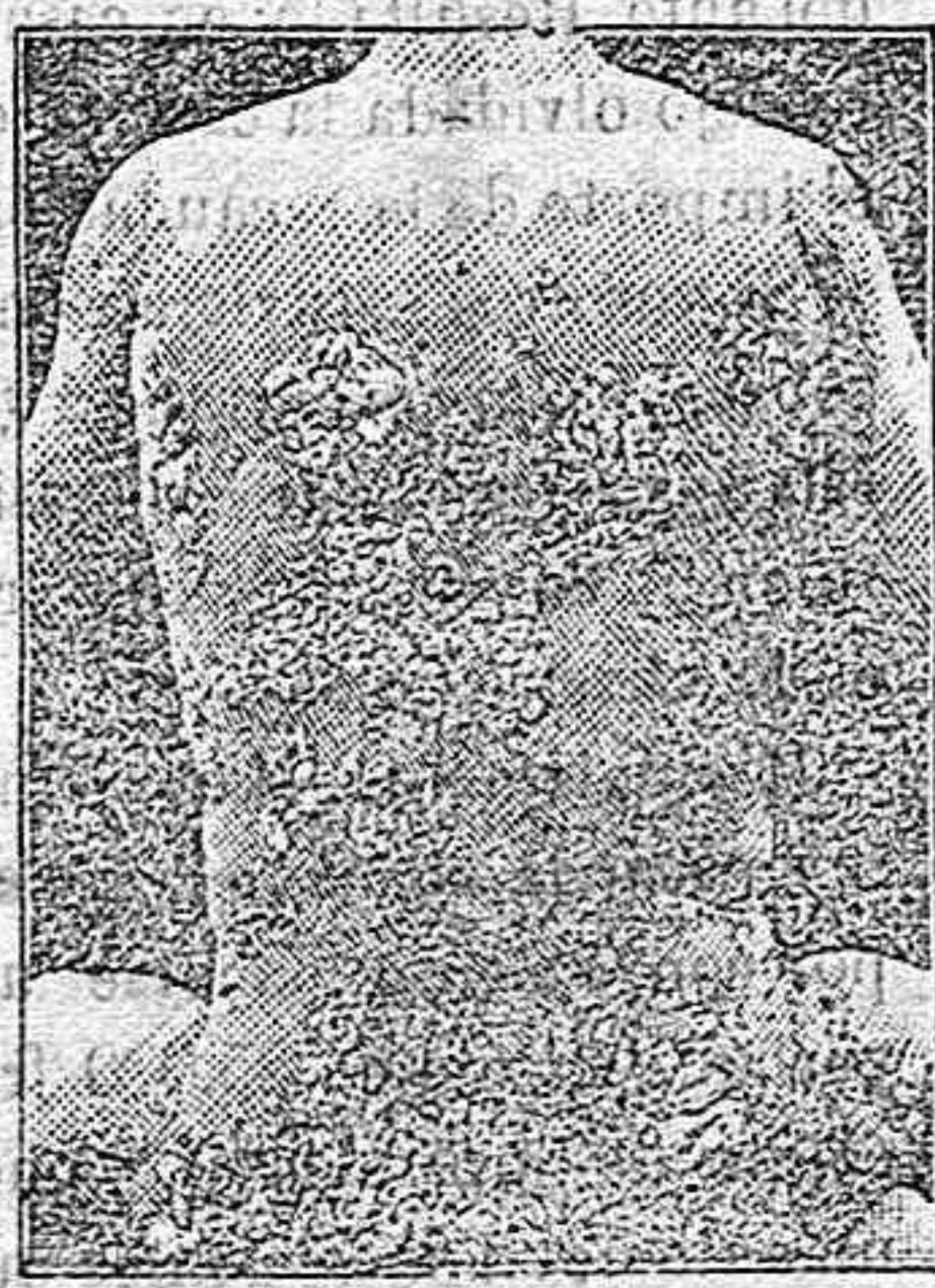
Ante la curación

Curación radical de todas las enfermedades de la piel, y las llagas de las piernas y del artrismo, reumatismo, etc. etc. etc. por medio del TRATAMIENTO DE RICHELET