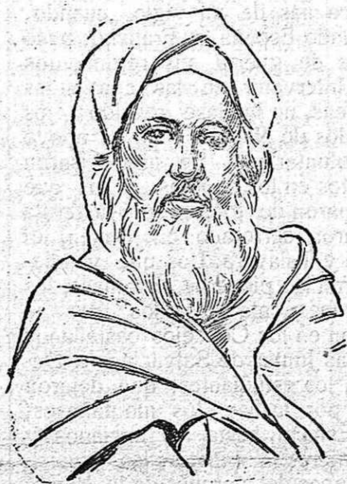
Mizzian «el Bueno» que sigue adicto a España.