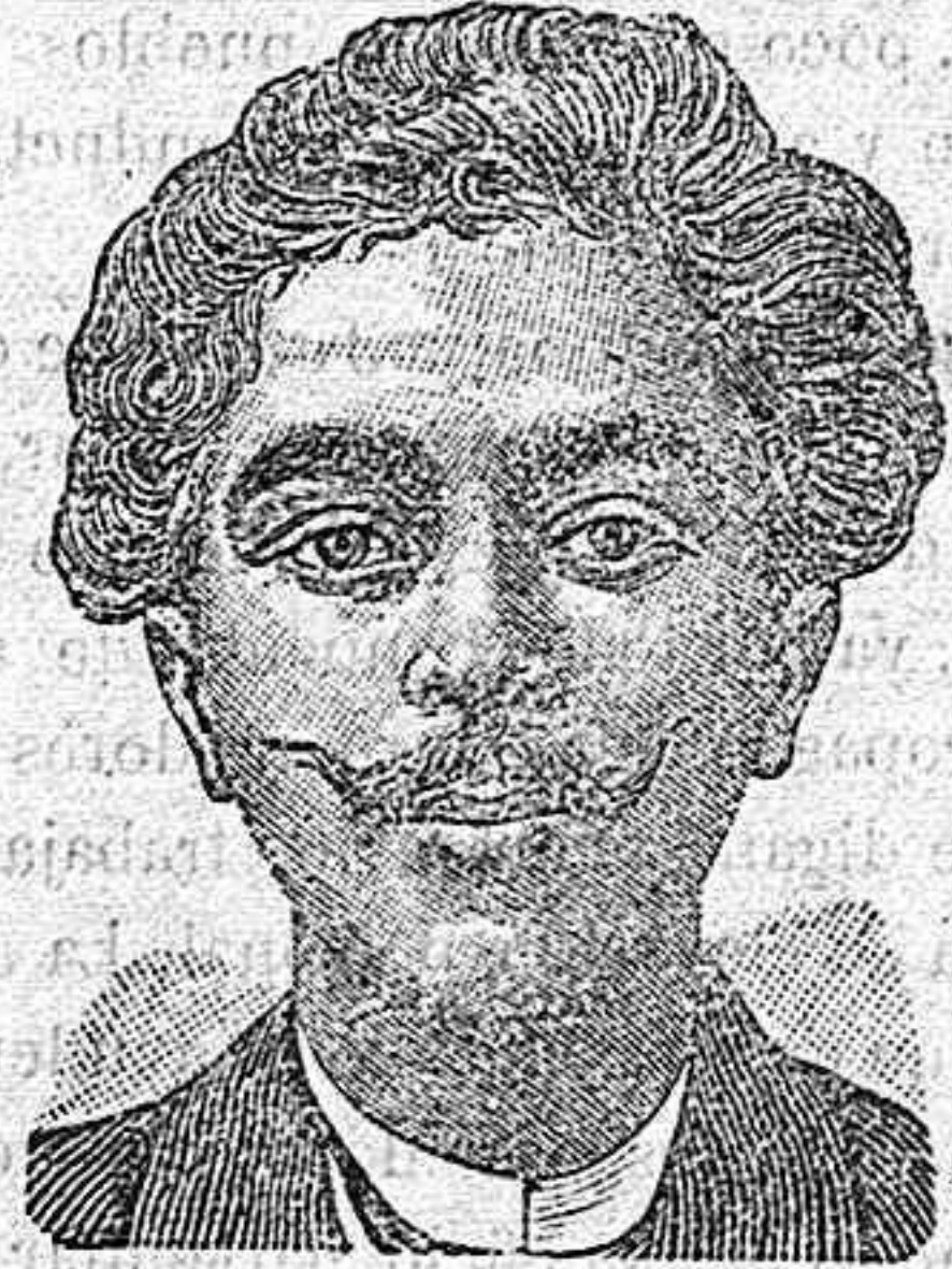
Después de 10 días de curación