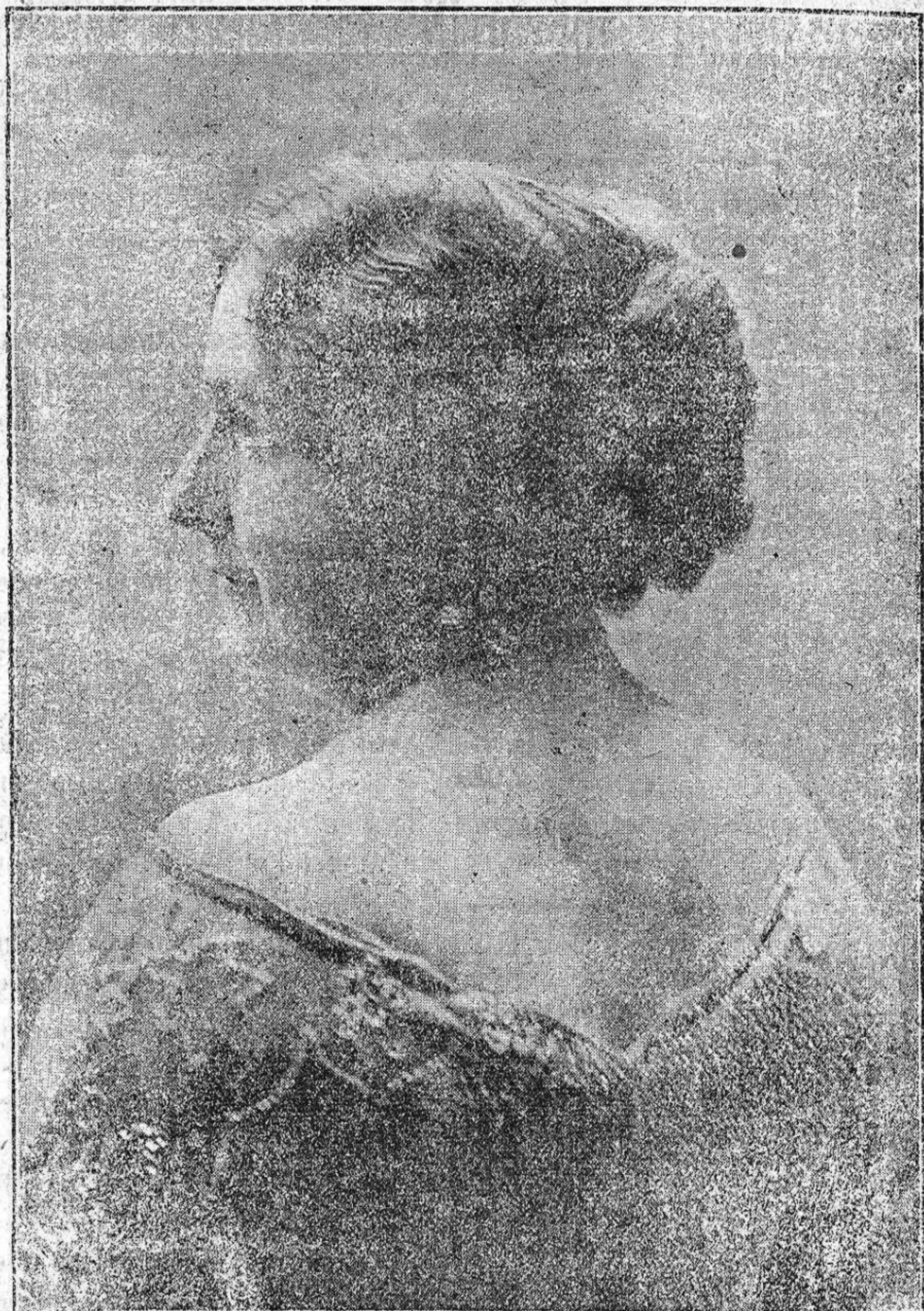
Bella artista que debuta esta noche en el Principal