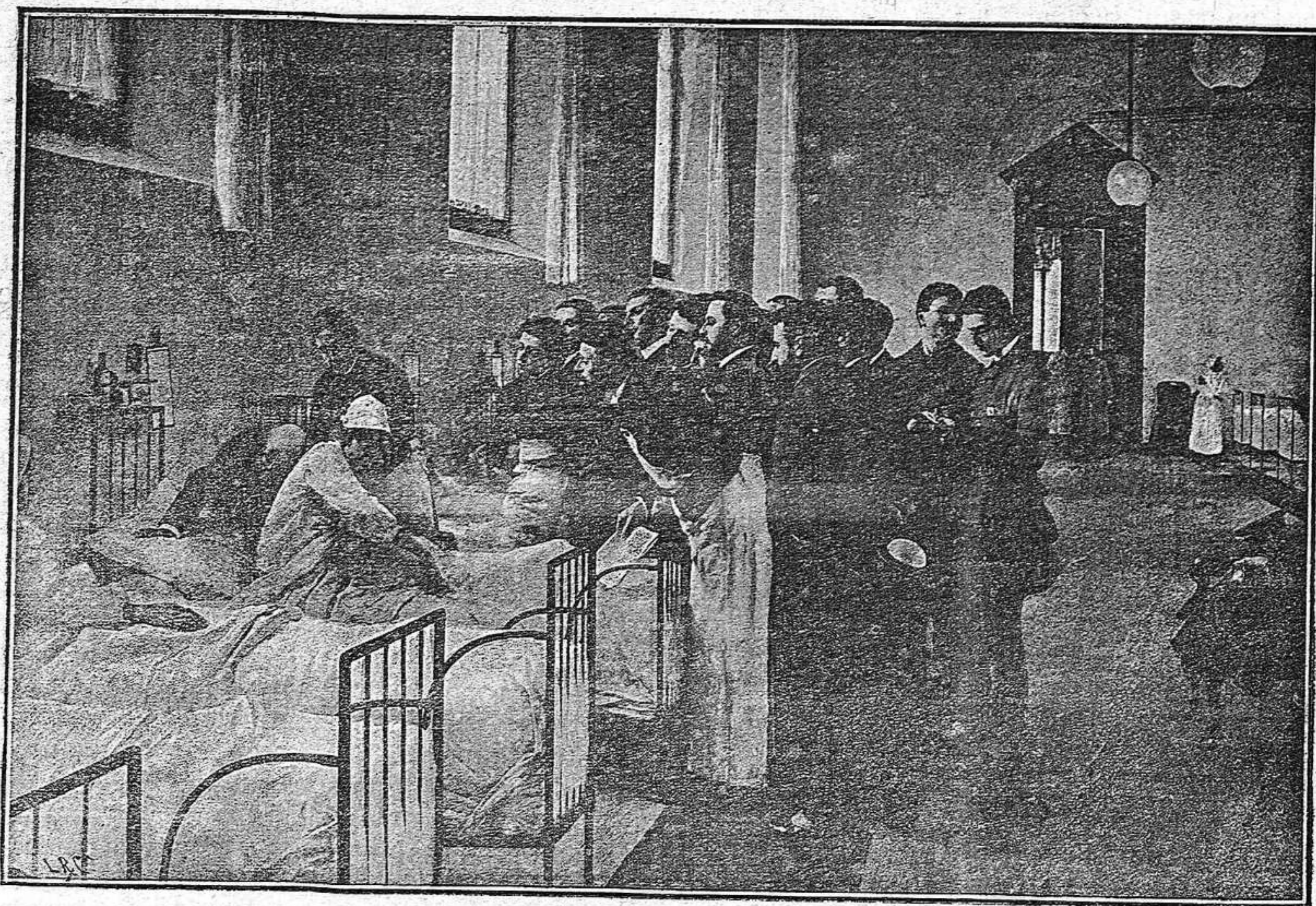
LA VISITA EN EL HOSPITAL