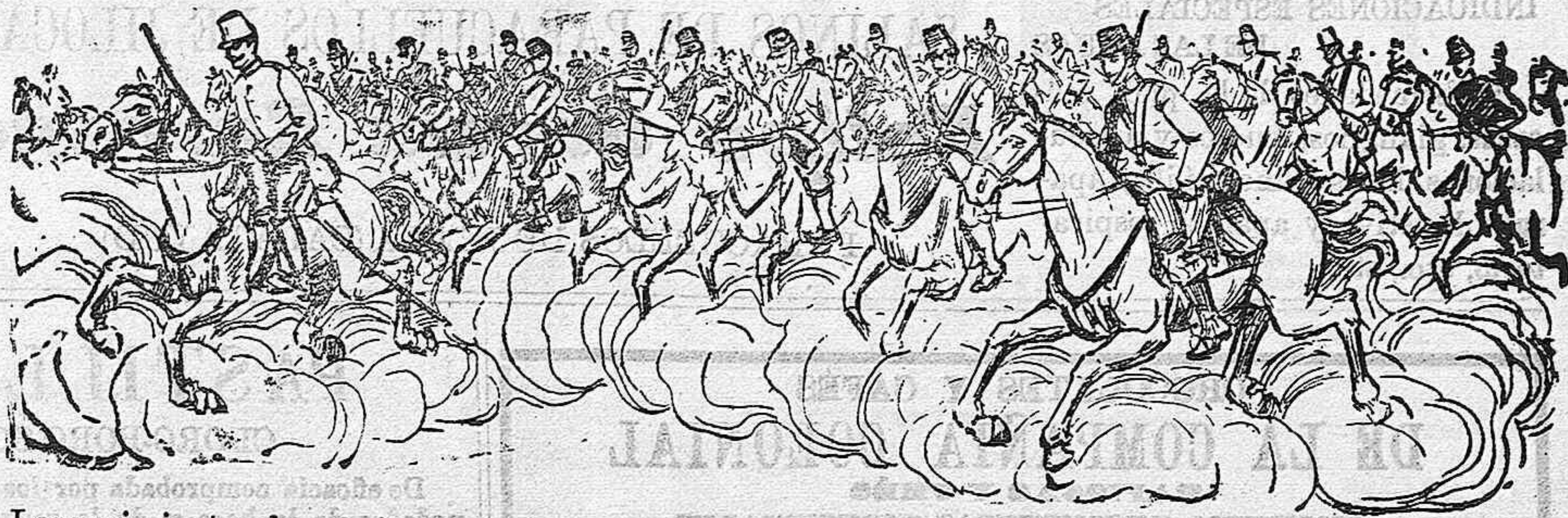
Los regimientos de caballería de Pavia y la Princesa simulando una carga en los campos de Calatayud.

Los jefes de las minorías preguntaron al Sr. Romero Robledo si hablaba autorizado por el gobierno, pues aunque la fórmula, á pesar de modificar en parte el acuerdo del 12 de Julio, lo consideraban aceptable, deseaban tener garantías de su cumplimiento.