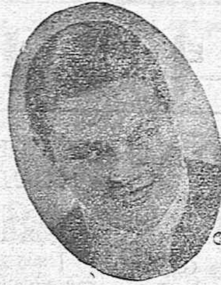
AZUCENA MAIZANI figura de la Compañía Argentina que nos visita mañana en el Marín.