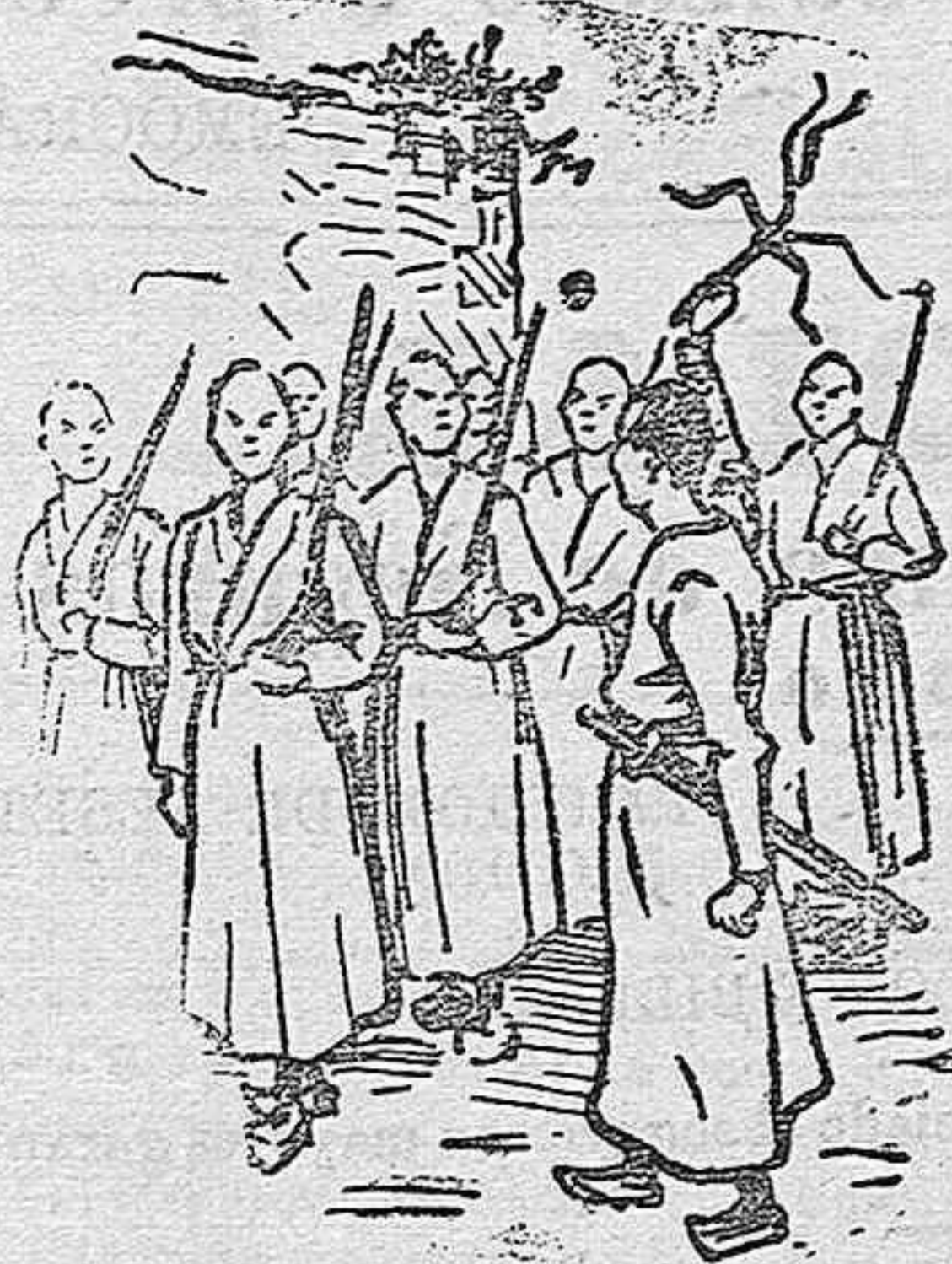
Ejercicio de soldados de infantería en 1870.