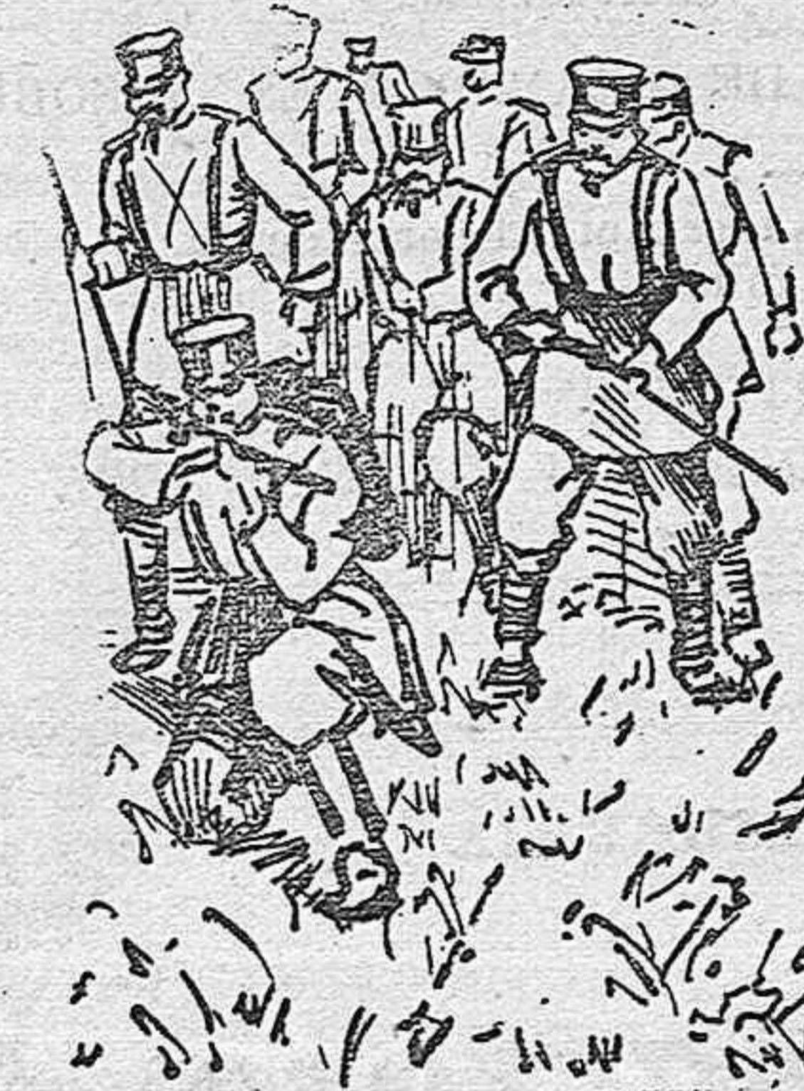
Infantería en campaña (1904).