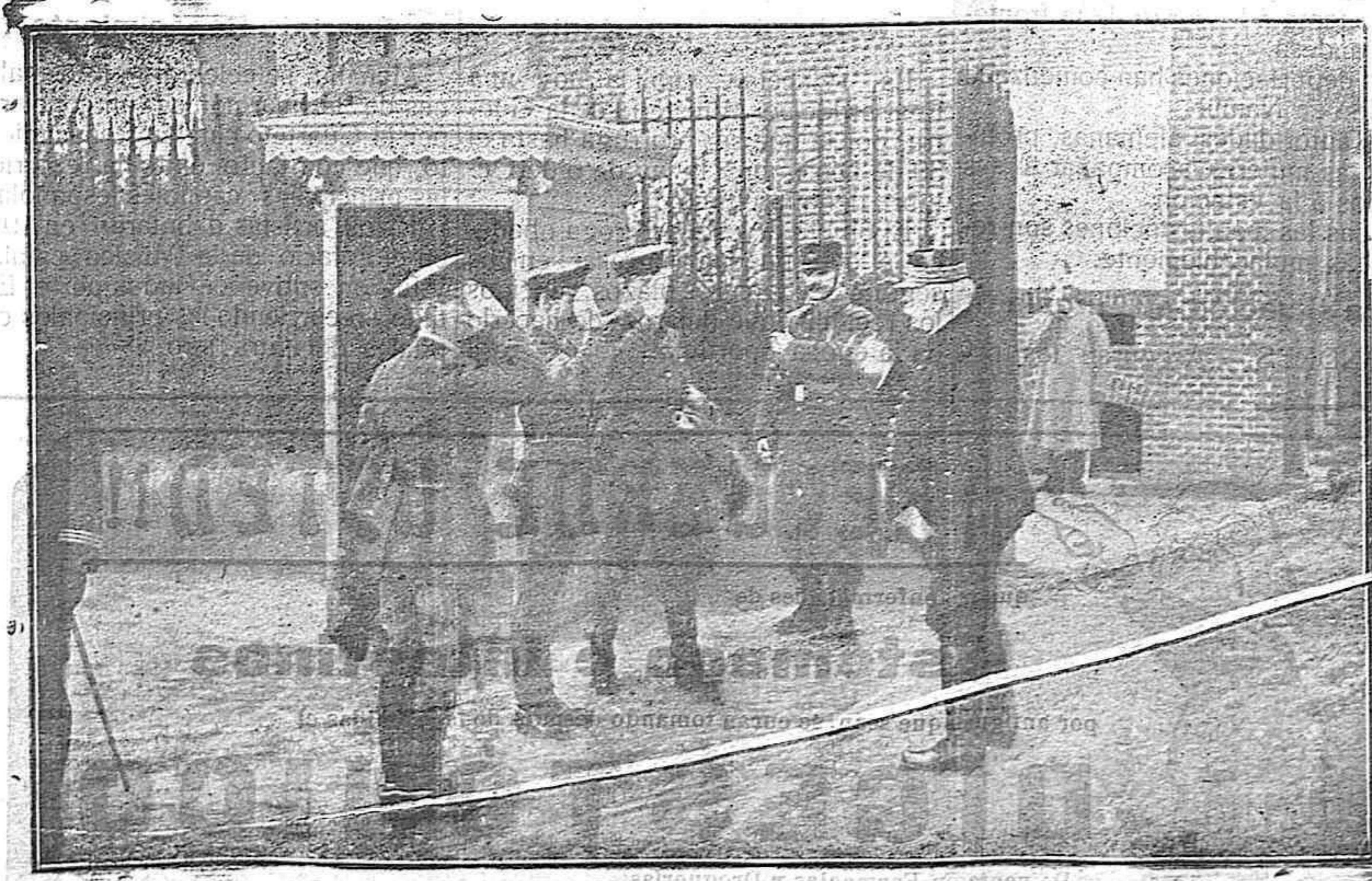
El general Joffre felicitando a los jefes Ingleses