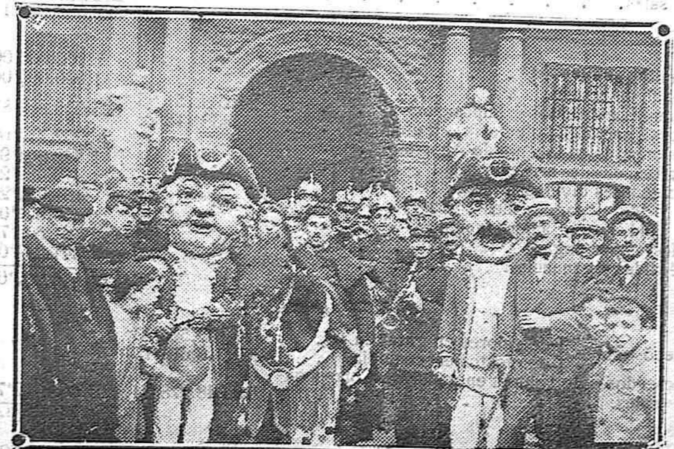
Los killiks de Pamplona que con los gigantes y cabezudos han hecho su aparición hoy en Vitoria

Que el encuentro será sensacional, lo indica los asiduos entrenamientos que ambos equipos celebran actualmente y de los que nos da cuenta la prensa regional.