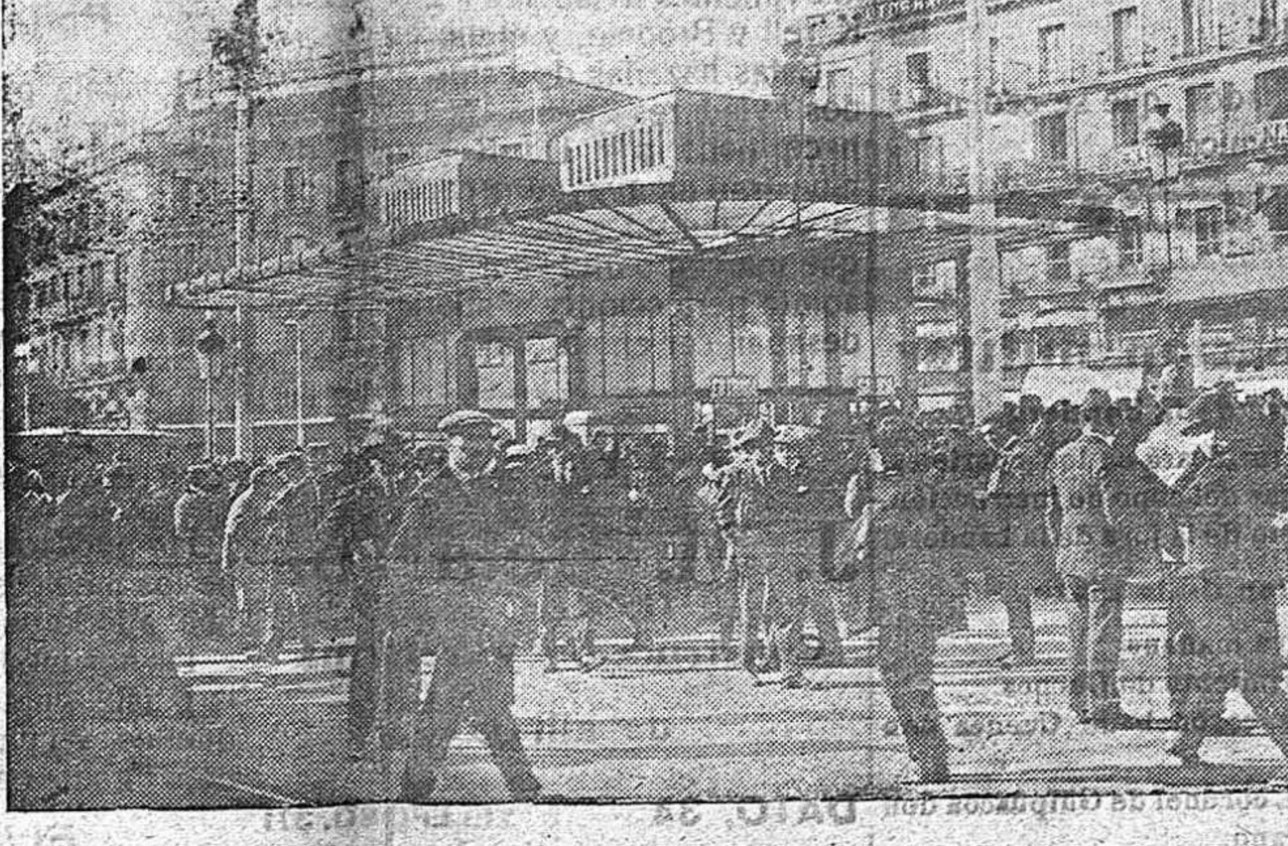
LA ESTACION DE LA PUERTA DEL SOL